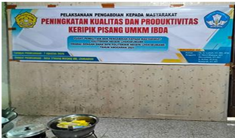
Gambar 4. Spanduk kegiatan yang sudah terpasang di lokasi PKM

Desain spanduk kemudian dikirim ke semua anggota PKM dan mitra. setelah mendapatkan masukan dan saran, spanduk kemudian dicetak sesuai dengan dengan ukuran yang ditentukan oleh P3M yaitu 3 \text{ m} \times 1 \text{ m} . Spanduk kemudian dipasang di dalam rumah produksi mitra di dekat tempat pembuatan keripik pisang (Gambar 4). Karena ruang produksi keripik tempe agak kecil dan sempit, spanduk dipasang tidak terlalu tinggi untuk memudahkan pengambilan foto untuk dokumentasi.