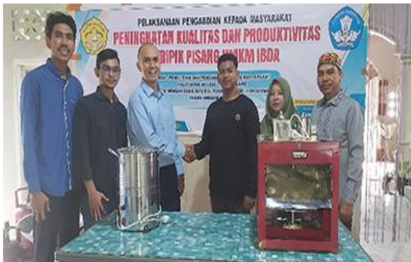
Gambar 11. Serah terima mesin pengiris keripik pisang dari tim PKM kepada mitra