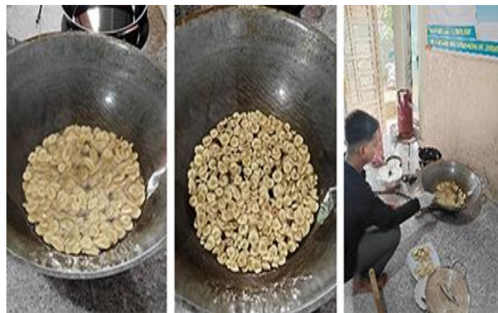
Gambar 8. Penggorengan hasil irisan pisang dan penirisan secara manual.

Penggorengan keripik pisang. Penggorengan keripik pisang seperti yang ditunjukkan pada Gambar 8 dilakukan hingga irisan pisang menjadi kekuningan. Untuk pisang yang akan diberi perasa, irisan pisang tidak diberi tambahan bumbu apapun sebelum dilakukan penggorengan kecuali untuk keripik pisang original yang diberi garam terlebih dahulu sebelum digoreng. Untuk keripik pisang rasa madu, irisan pisang digoreng setengah matang sebelum dicelup ke dalam larutan madu dan gula. Gula ditambahkan ke dalam madu supaya madu bisa lengket ke permukaan keripik. Setelah itu keripik kemudian digoreng lagi hingga matang.