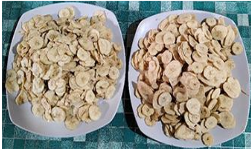
Gambar 7. Hasil irisan pisang secara manual (kanan) dan pakai mesin (kiri).

Penggorengan keripik pisang. Penggorengan keripik pisang seperti yang ditunjukkan pada Gambar 8 dilakukan hingga irisan pisang menjadi kekuningan. Untuk pisang yang akan diberi perasa, irisan pisang tidak diberi tambahan bumbu apapun sebelum dilakukan penggorengan kecuali untuk keripik pisang original yang diberi garam terlebih dahulu sebelum digoreng. Untuk keripik pisang rasa madu, irisan pisang digoreng setengah matang sebelum dicelup ke dalam larutan madu dan gula. Gula ditambahkan ke dalam madu supaya madu bisa lengket ke permukaan keripik. Setelah itu keripik kemudian digoreng lagi hingga matang.