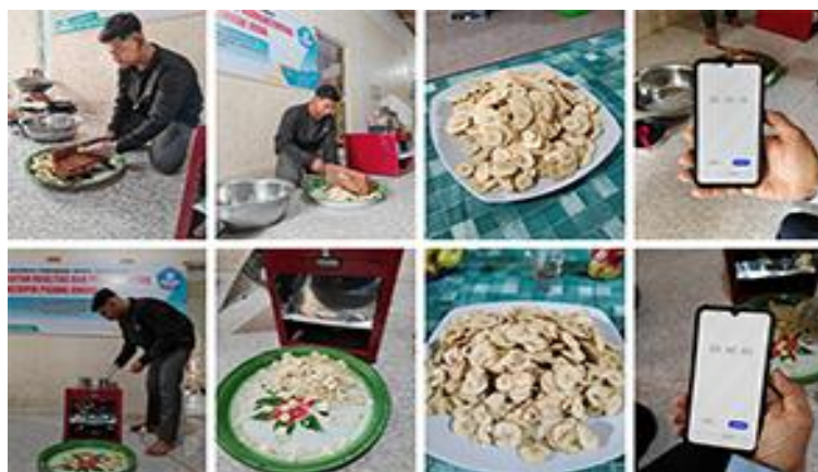
Gambar 6. Pengirisan bahan baku keripik pisang secara manual (atas) dan pakai mesin (bawah).

Pemeriksaan hasil irisan pisang lebih lanjut seperti pada Gambar 7. menunjukkan hasil irisan manual lebih tebal sehingga persentase irisan yang rusak lebih sedikit dibandingkan hasil irisan pakai mesin. Namun jumlah irisan pakai mesin lebih banyak dan sisa pisang yang tidak teriris jauh lebih sedikit. Hal ini karena mesin pengiris menggunakan penekan dari kayu ketika pisang diumpankan ke mata pengiris sehingga pengirisan bahan baku pisang dapat dilakukan hingga pisang benar-benar habis.