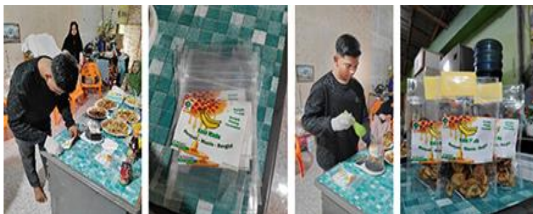
Gambar 10. Pemasangan label dan pengemasan keripik pisang ke dalam kemasan standing pouch

Pengemasan keripik pisang. Ada banyak jenis kemasan yang digunakan untuk pengemasan keripik tempe, namun dalam kunjungan tim PKM ke tempat mitra, pengemasan produk hanya dilakukan untuk kemasan standing pouch saja. Seperti yang terlihat pada Gambar 10, proses pengemasan dimulai dengan menempelkan label kemasan pada permukaan luar standing pouch. Setelah semuanya selesai, barulah keripik pisang dimasukkan ke dalam kemasan. Standing pouch yang sudah diisi kemudian ditimbang dengan menggunakan timbangan digital. Hasil akhir produk keripik pisang yang sudah dikemas dapat dilihat pada Gambar 10. paling kanan.