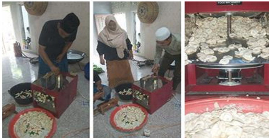
Gambar 2. Uji coba mesin pengiris keripik pisang di rumah mitra

Dalam pengujian, digunakan sekitar 2 sisir pisang yang dikupas terlebih dahulu oleh mitra sebelum tim PKM tiba di rumah mitra. Mesin dibersihkan terlebih dahulu untuk menghilangkan kotoran dan minyak yang digunakan untuk mencegah karat pada mesin. Untuk posisi pisang vertikal, mesin dapat dimasukkan sekitar 3-4 buah pisang untuk diiris secara bersamaan. Dalam uji coba ini mitra mencari cara terbaik untuk mengoperasikan mesin untuk menghasilkan irisan yang baik dengan persentase kerusakan hasil irisan yang minim dengan waktu yang cepat dan efisien. Setelah melakukan beberapa kali uji coba, cara yang terbaik diperoleh dengan memotong pisang yang sudah dikupas menjadi dua bagian sebelum diumpungkan secara vertikal ke mata pemotong mesin.