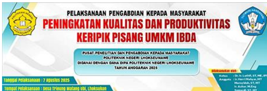
Gambar 3. Desain spanduk kegiatan PKM

Pembuatan spanduk kegiatan. Setelah proses pengujian alat selesai dilakukan, tim PKM dan mitra siap untuk melaksanakan kegiatan pengabdian untuk dinilai oleh tim pemantau P3M. Langkah awal persiapan pelaksanaan kegiatan pengabdian adalah mempersiapkan spanduk kegiatan. Pembuatan spanduk kegiatan dilakukan berdasarkan template yang disediakan oleh P3M. Warna spanduk dan latar belakang spanduk disesuaikan dengan logo PNL dan logo Kemendikbud agar tetap terlihat jelas. Warna teks disesuaikan dengan warna latar belakang dan ukurannya diatur sedemikian rupa agar tetap terlihat jelas. Hasil dari desain spanduk kegiatan dapat dilihat pada Gambar 3.