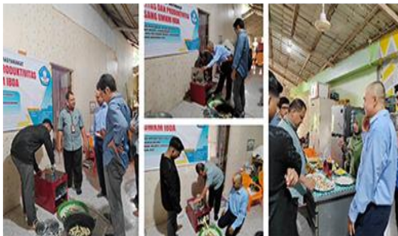
Gambar 5. Pemantauan kegiatan PKM oleh tim pemantau

Perbandingan iris manual dengan iris pakai mesin. Untuk menguji seberapa efektif mesin pengiris keripik pisang dalam menggantikan alat pengiris pisang manual, mitra diminta untuk mengiris masing-masing sebanyak 12 buah pisang yang telah dikupas dengan menggunakan pengiris manual dan dengan menggunakan mesin pengiris keripik pisang yang dihibahkan tim PKM. Durasi pengirisan keripik dipantau dengan menggunakan stopwatch smartphone (Gambar 6). Metode yang serupa juga diterapkan oleh beberapa kegiatan pengabdian masyarakat yang lain [9–11].