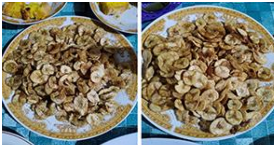
Gambar 9. Keripik pisang irisan manual (kanan) dan irisan mesin (kiri)

Pengemasan keripik pisang. Ada banyak jenis kemasan yang digunakan untuk pengemasan keripik tempe, namun dalam kunjungan tim PKM ke tempat mitra, pengemasan produk hanya dilakukan untuk kemasan standing pouch saja. Seperti yang terlihat pada Gambar 10, proses pengemasan dimulai dengan menempelkan label kemasan pada permukaan luar standing pouch. Setelah semuanya selesai, barulah keripik pisang dimasukkan ke dalam kemasan. Standing pouch yang sudah diisi kemudian ditimbang dengan menggunakan timbangan digital. Hasil akhir produk keripik pisang yang sudah dikemas dapat dilihat pada Gambar 10. paling kanan.