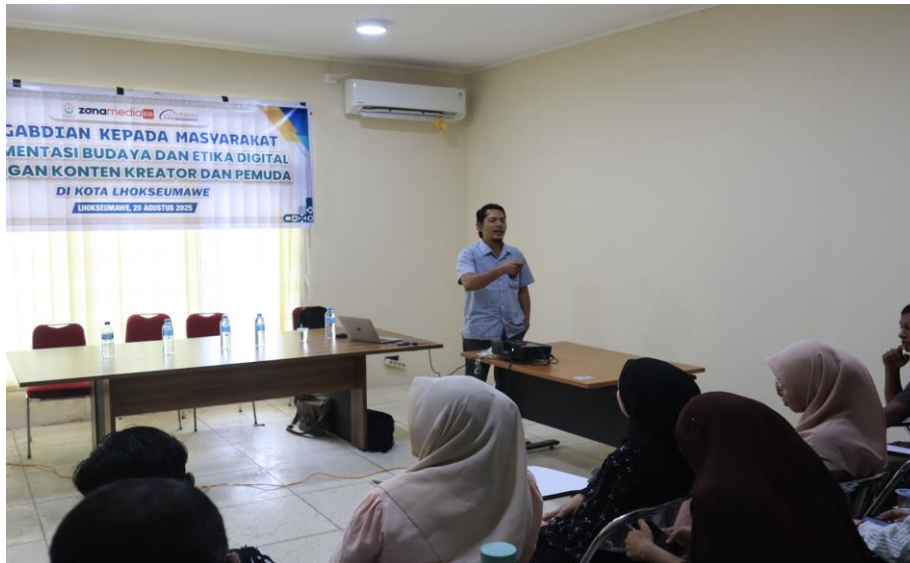
Gambar 4. Pemateri memaparkan materi pelatihan

Hasil post-test merupakan cerminan konkret dari tingkat pengetahuan, pemahaman, dan sikap peserta setelah mengikuti kegiatan pembelajaran atau pengabdian masyarakat yang dilakukan terhadap masyarakat Lancang Garam. Data yang diperoleh dari post-test memberikan gambaran objektif mengenai efektivitas penyampaian materi serta sejauh mana peserta mampu menginternalisasi konsep yang diajarkan. Dengan demikian, hasil post-test dapat dijadikan sebagai dasar evaluasi yang valid untuk menilai pencapaian tujuan kegiatan serta menentukan keberhasilan program. Evaluasi ini juga berfungsi sebagai acuan dalam perbaikan dan pengembangan metode pembelajaran di masa mendatang guna meningkatkan kualitas dan dampak intervensi edukatif secara berkelanjutan. Adapun suasana saat pemateri memaparkan materi pelatihan dapat dilihat pada Gambar 4.