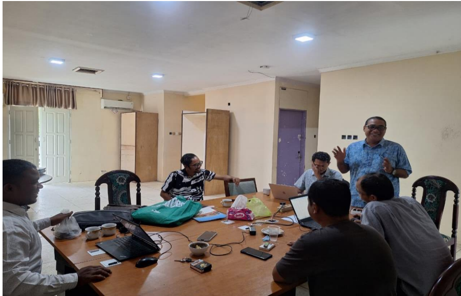
Gambar 2. Rapat persiapan kegiatan pelatihan

Pelaksanaan pre-test dalam kegiatan pengabdian ini memiliki urgensi sebagai langkah awal untuk mengetahui tingkat pengetahuan dan kesadaran peserta terkait budaya serta etika digital sebelum kegiatan dilaksanakan. Melalui pre-test , tim dapat mengidentifikasi kebutuhan dan kesenjangan pemahaman di kalangan konten kreator dan pemuda Gampoeng Lancang Garam, sehingga materi yang disampaikan lebih tepat sasaran dan kontekstual. Selain itu, hasil pre-test menjadi acuan untuk mengevaluasi efektivitas kegiatan melalui perbandingan dengan post-test , sehingga dapat diukur peningkatan literasi dan sikap etis peserta terhadap penggunaan media digital secara berbudaya. Rapat persiapan kegiatan pelatihan dapat dilihat pada Gambar 2.