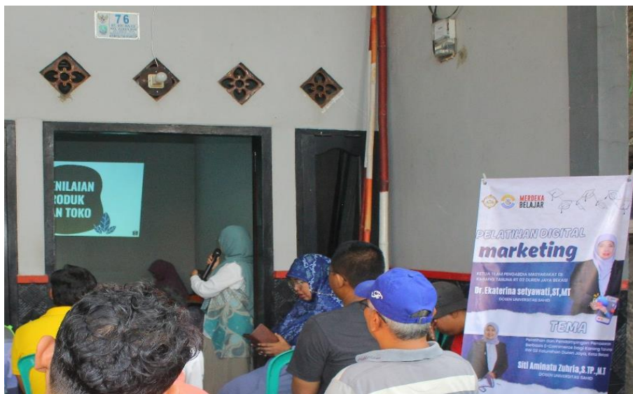
Gambar 1. Pemaparan materi terkait digital marketing

Materi yang diberikan berupa dasar pengantar digital marketing, pentingnya digital marketing, keuntungan digital marketing, dan tantangan penggunaan digital marketing. Pelatihan juga mencakup praktik pembuatan akun Shopee dan WhatsApp Bisnis. Peserta diarahkan langkah demi langkah mulai dari proses registrasi, pengaturan profil toko, hingga cara menampilkan produk secara menarik di Shopee seperti terlihat pada Gambar 2.