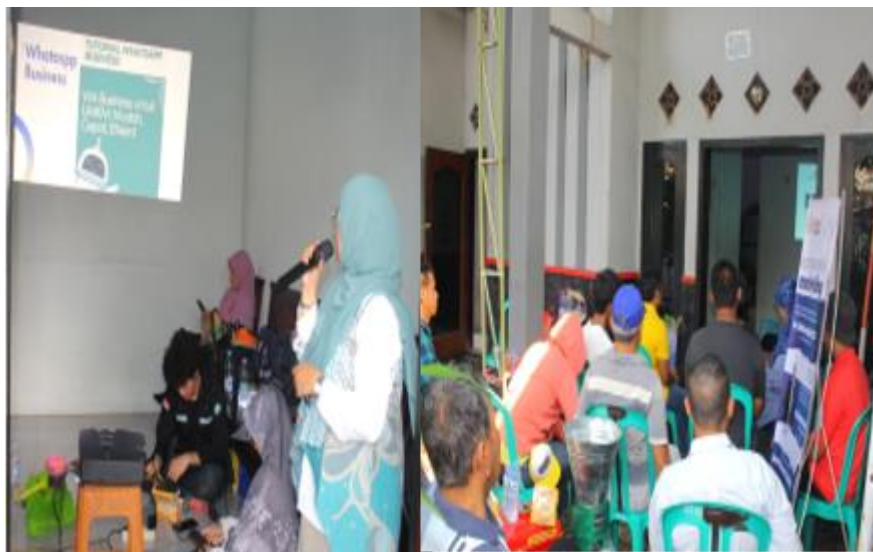
Gambar 3. Materi tentang Whatsapp Business

dan lebih efisien dibandingkan metode tradisional, pemasaran digital juga memungkinkan bisnis untuk terus memperoleh pelanggan melalui sistem promosi yang berjalan secara pasif [10].