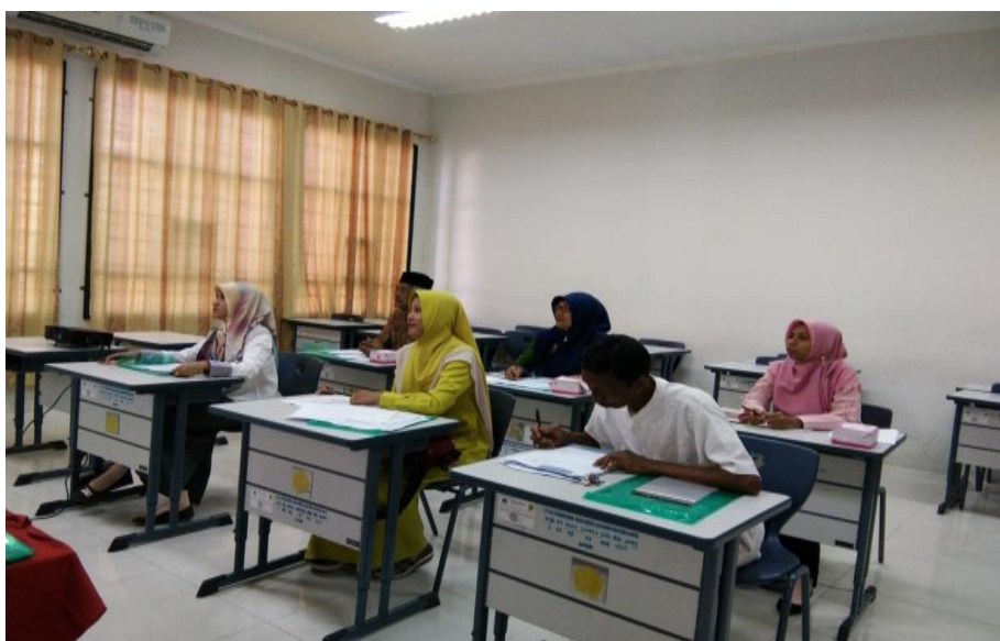
Gambar 3. Peserta sedang mengikuti Pretest

Peserta yang mengikuti pelatihan penyusunan laporan pertanggung jawaban dana desa dilakukan uji pretest terlebih dahulu, peserta yang mengikuti pretest memiliki kualifikasi pendidikan SMA dan Diploma serta memiliki tingkat pengetahuan yang baik dalam dalam membuat laporan keuangan. Berikut ini disajikan photo kegiatan pretest awal dari peserta merujuk pada gambar 3.