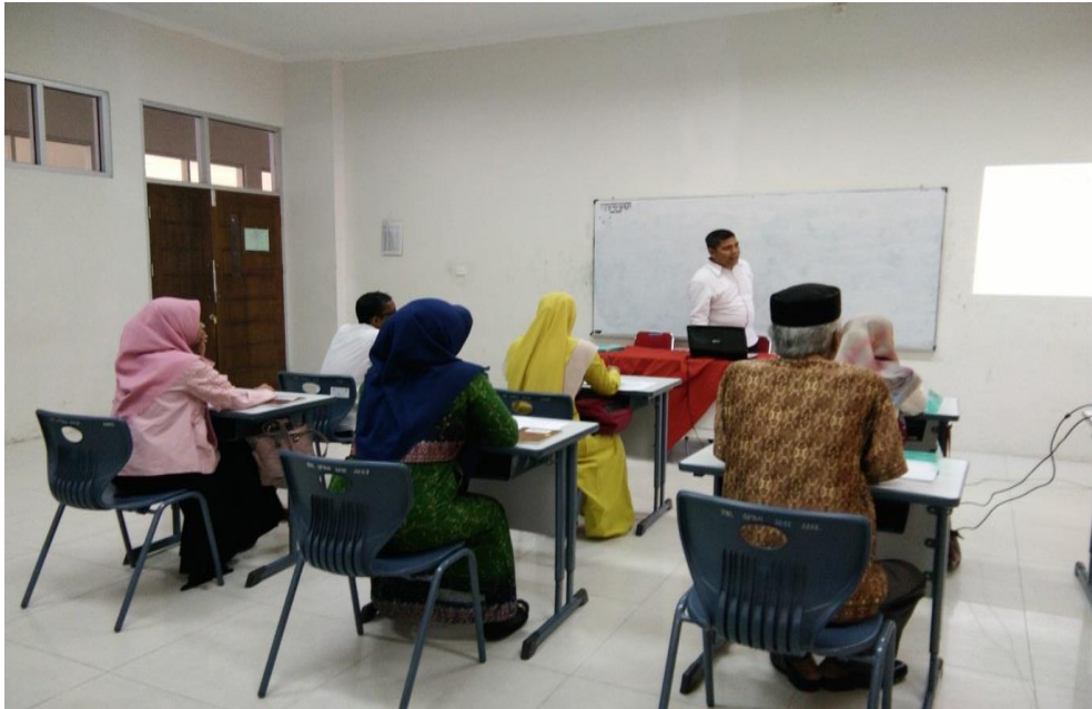
Gambar. 5 Peserta sedang mengikuti pelatihan lanjutan dan diskusi panel

Selanjutnya pada gambar 5 posttest dan juga diberikan format laporan pertanggungjawaban dana desa, dimana peserta juga dibekali dengan format laporan realisasi pelaksanaan anggaran pendapatan dan belanja desa, dan juga dibekali dengan contoh format laporan pertanggungjawaban pembelajaran dengan contoh kasus pengaspalan jalan desa, nantinya ini menjadi bagian dari dari laporan realisasi pelaksanaan anggaran pendapatan dan belanja desa.