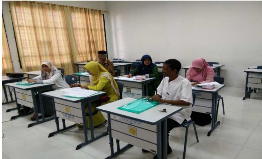
Gambar 2. Foto Peserta Pelatihan

Kegiatan pengabdian penyusunan laporan pertanggungjawaban dana desa dilaksanakan di ruangan laboratoriu Anggaran prodi akuntansi. Peserta pelatihan diikuti aparatur desa Meunasah Mesjid Punteut yang berjumlah 6 (enam) orang yang terlibat dalam penyusunan laporan pertanggungjawaban dana desa. Aparat yang terlibat penyusunan dana desa terdiri dari kepala desa, sekretaris, bendahara, kasi pembangunan, kasi ekonomi dan kasi kesejahteraan. Berikut ini photo peserta pelatihan yang ditampilkan pada gambar 2.