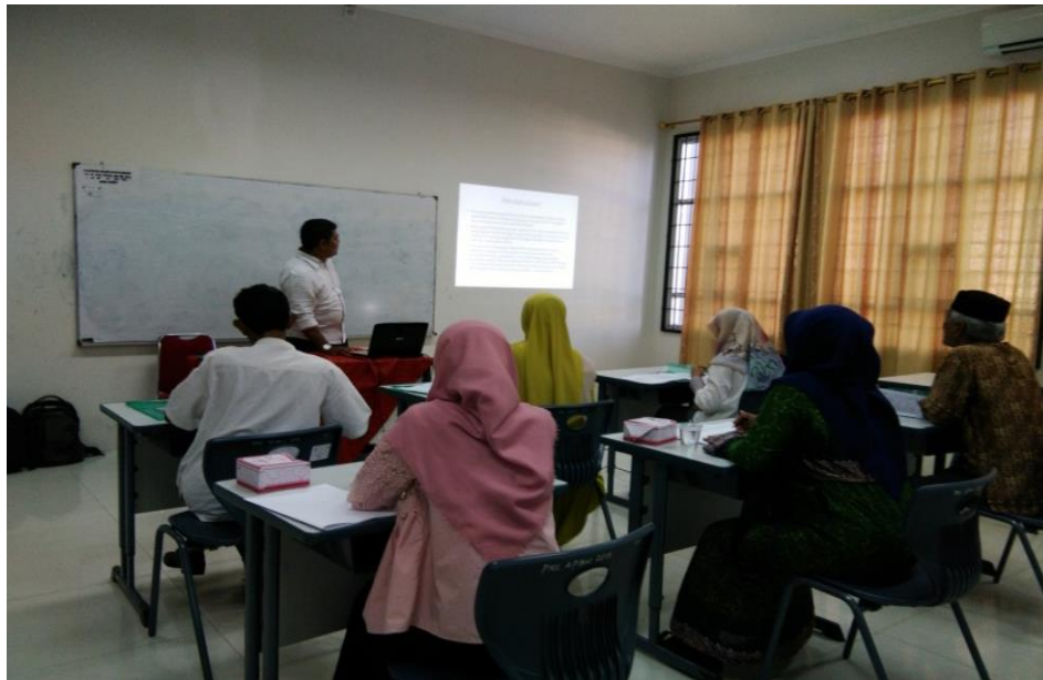
Gambar 4. Peserta sedang mengikuti Pelatihan

Pada sesi selanjutnya instruktur memberikan contoh kasus penyusunan pelaporan pertanggung jawaban penggunaan dana untuk pengaspalan jalan desa, kasus ini harus diselesaikan oleh peserta dari membuat RAD sampai pada proses pembayaran penyelesaian proyek. Berdasarkan hasil pekerjaan peserta dapat diambil kesimpulan peserta sudah memahami cara penyusun pertanggungjawaban dana desa, selain keberhasilan terdapat juga kendala pada saat menganalisis transaksi, sehingga perlu penjelasan yang lebih mendalam lagi dari pelaksana pengabdian. Berikut ini ditampilkan gambar 3 dan 4 mengenai diskusi yang seru antara peserta dan instruktur pelatihan.