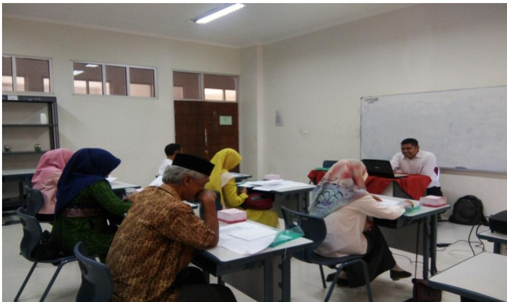
Gambar 6. Peserta sedang Mengikuti Posttest

Selanjutnya pada gambar 5 posttest dan juga diberikan format laporan pertanggungjawaban dana desa, dimana peserta juga dibekali dengan format laporan realisasi pelaksanaan anggaran pendapatan dan belanja desa, dan juga dibekali dengan contoh format laporan pertanggungjawaban pembelajaran dengan contoh kasus pengaspalan jalan desa, nantinya ini menjadi bagian dari dari laporan realisasi pelaksanaan anggaran pendapatan dan belanja desa.