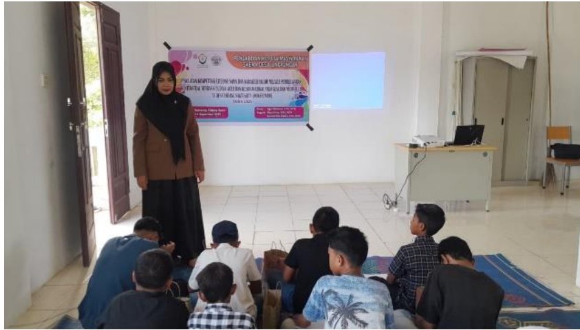
Gambar 5. Pembinaan karakter Islami

ini, materi yang diberikan mencakup kajian tematik, praktik ibadah berjamaah, diskusi nilai-nilai Islami, serta internalisasi etika sosial dalam kehidupan bermasyarakat.