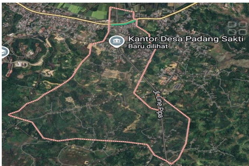
Gambar 2. Peta Lokasi Pengabdian Kepada Masyarakat