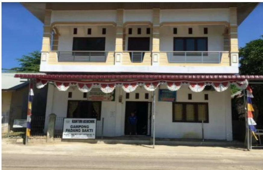
Gambar 1. Kantor Geuchik Gampong Padang Sakti

Gambar 1 memperlihatkan Kantor Geuchik Gampong Padang Sakti sebagai pusat kegiatan pemerintahan dan pembinaan masyarakat di tingkat gampong. Dari sinilah berbagai program pembangunan dan pembinaan generasi muda dijalankan. Namun demikian, di tengah upaya pembangunan tersebut, perkembangan zaman modern menghadirkan tantangan yang cukup kompleks, khususnya bagi generasi muda. Pengaruh globalisasi dan derasnya arus informasi digital telah menggeser pola pikir dan perilaku mereka (4). Generasi muda lebih sering mengakses media sosial dibandingkan menggali pengetahuan melalui sumber literasi ilmiah, sehingga berdampak pada lemahnya penguasaan literasi sains yang seharusnya menjadi kompetensi penting di era abad ke-21(5). Oleh karena itu, generasi muda perlu terus termotivasi untuk memanfaatkan peluang yang ada, meningkatkan semangat belajar, serta menjadikan literasi sains sebagai bekal berharga dalam menghadapi persaingan global dan membangun masa depan bangsa yang lebih baik (6).