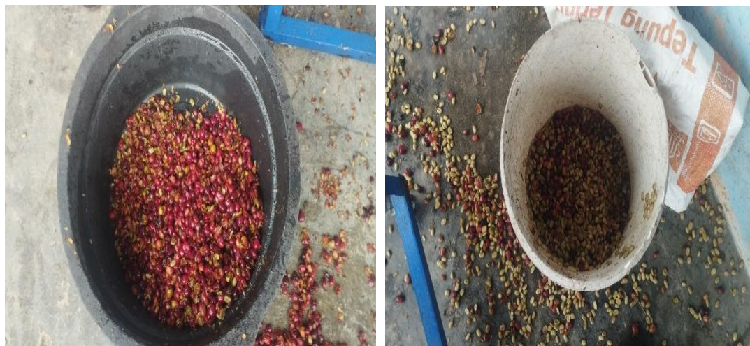
Gambar 10. Hasil Pengupasan Kopi

Tahap kegiatan selanjutnya difokuskan pada penerapan digital marketing . Dalam sesi ini, tim pengabdian memberikan pelatihan kepada mitra terkait pembuatan akun penjual di marketplace , khususnya platform Shopee , sebagai media pemasaran produk secara daring. Mitra dibimbing mulai dari proses registrasi akun, teknik mengunggah foto produk yang menarik, penyusunan deskripsi yang informatif, penetapan harga jual, hingga pengelolaan pesanan dan layanan pelanggan. Setelah seluruh rangkaian kegiatan selesai, maka tim pengabdian dan mitra melakukan sesi foto Bersama seperti pada gambar 11.