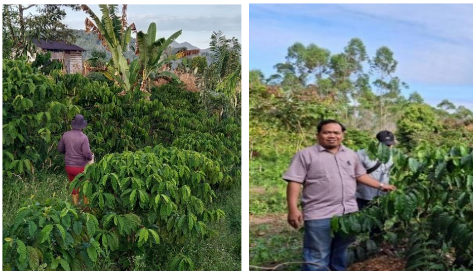
Gambar 1. Ketua Pengusul dan mitra di kebun kopi kelompok tani

Proses pengupasan kopi masih dilakukan secara manual dengan produktivitas hanya 10 kg per jam, sehingga membutuhkan waktu sekitar 5–6 jam per hari untuk mengupas hasil panen [6]. Jika menyewa mesin pengupas dari kelompok lain, mitra harus mengeluarkan biaya tambahan sebesar 10% hasil pengupasan, atau sekitar 5 kg per hektar. Kondisi ini membuat petani sering menjual buah kopi gelondongan dengan harga rendah, sehingga kesejahteraan mereka sulit meningkat [4]. Gambar 2 memperlihatkan Ketua Kelompok Sadar Ingin Maju yang masih menggunakan penggiling manual dalam proses pengolahan kopi. Hal ini memperkuat bukti bahwa teknologi yang digunakan masih sangat sederhana dan tidak efisien.