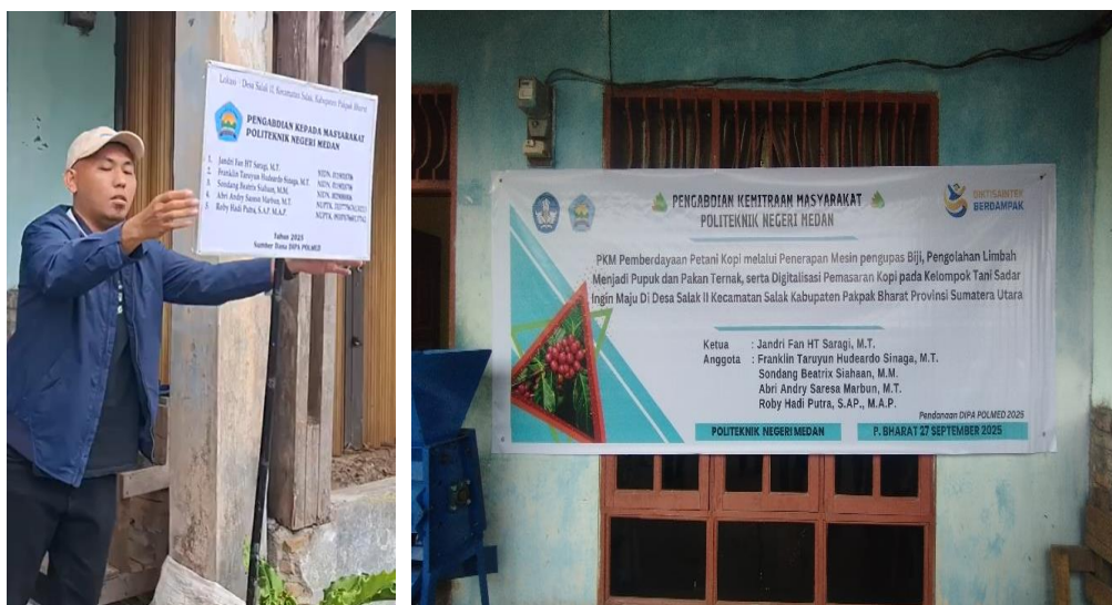
Gambar 7. Pemasangan plang dan spanduk

Kegiatan pengabdian kepada masyarakat ini diselenggarakan pada tanggal 27 September 2025 di lokasi mitra di Desa Salak II, Kecamatan Salak, Kabupaten Pakpak Bharat. Pada pertemuan pertama, kegiatan diikuti oleh 20 orang peserta yang terdiri atas mitra dan tim pelaksana pengabdian. Setibanya di lokasi, tim pengabdian melakukan persiapan mesin yang akan digunakan dalam praktik, sementara mahasiswa mendampingi pelaksanaan registrasi melalui pengisian daftar hadir peserta. Setelah seluruh persiapan selesai, termasuk pemasangan spanduk, plang pengabdian, serta penataan area kegiatan seperti tampak pada gambar 7, acara resmi dimulai pukul 09.00 WIB dengan sambutan dari ketua tim pengabdian.