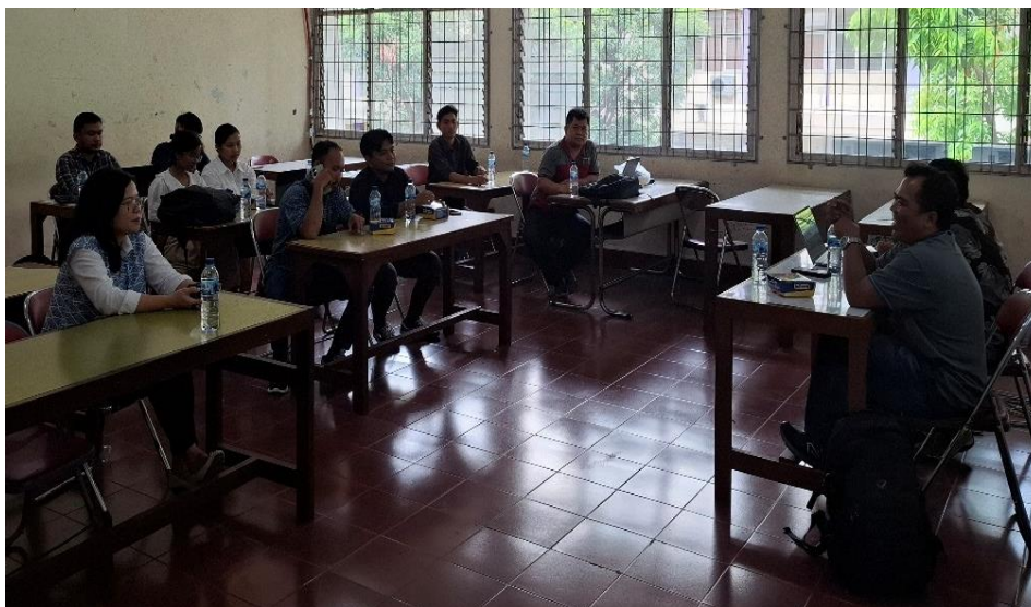
Gambar 6. Rapat Tim

Tahap persiapan difokuskan pada penyediaan seluruh peralatan dan bahan yang diperlukan, seperti mesin, spanduk, plang pengabdian dan perlengkapan pendukung lainnya.