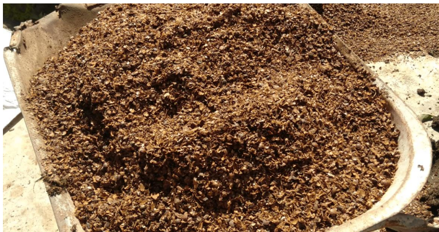
Gambar 3. Limbah kopi hasil pemipilan

pemipilan yang selama ini hanya menumpuk di kebun. Limbah ini berpotensi besar untuk diolah menjadi pupuk organik maupun pakan, namun belum dimanfaatkan oleh mitra..