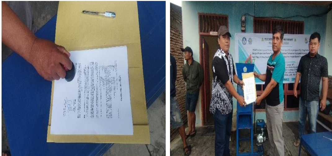
Gambar 8. Serah terima mesin

pengupasan sebelumnya masih mengandalkan peralatan tradisional yang menghasilkan produksi terbatas. Setelah itu, acara berlanjut dengan prosesi penandatanganan dokumen serah terima serta penyerahan mesin pengupas kopi kepada mitra seperti tampak pada gambar 8.