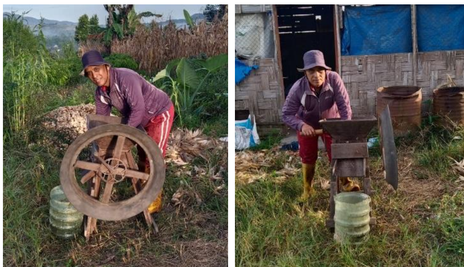
Gambar 2. Ketua Kelompok sedang menggiling kopi dengan penggiling manual

Proses pengupasan kopi masih dilakukan secara manual dengan produktivitas hanya 10 kg per jam, sehingga membutuhkan waktu sekitar 5–6 jam per hari untuk mengupas hasil panen [6]. Jika menyewa mesin pengupas dari kelompok lain, mitra harus mengeluarkan biaya tambahan sebesar 10% hasil pengupasan, atau sekitar 5 kg per hektar. Kondisi ini membuat petani sering menjual buah kopi gelondongan dengan harga rendah, sehingga kesejahteraan mereka sulit meningkat [4]. Gambar 2 memperlihatkan Ketua Kelompok Sadar Ingin Maju yang masih menggunakan penggiling manual dalam proses pengolahan kopi. Hal ini memperkuat bukti bahwa teknologi yang digunakan masih sangat sederhana dan tidak efisien.