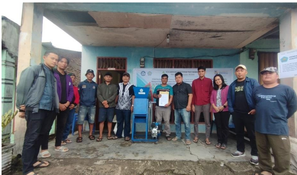
Gambar 11. Foto Bersama Tim dan Mitra

Tahap kegiatan selanjutnya difokuskan pada penerapan digital marketing . Dalam sesi ini, tim pengabdian memberikan pelatihan kepada mitra terkait pembuatan akun penjual di marketplace , khususnya platform Shopee , sebagai media pemasaran produk secara daring. Mitra dibimbing mulai dari proses registrasi akun, teknik mengunggah foto produk yang menarik, penyusunan deskripsi yang informatif, penetapan harga jual, hingga pengelolaan pesanan dan layanan pelanggan. Setelah seluruh rangkaian kegiatan selesai, maka tim pengabdian dan mitra melakukan sesi foto Bersama seperti pada gambar 11.