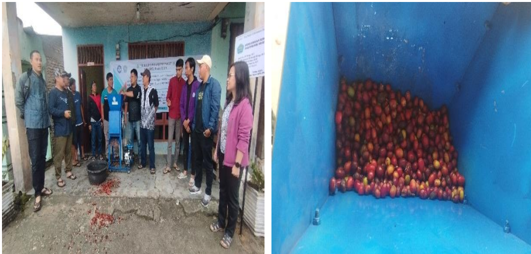
Gambar 9. Simulasi mesin

Gambar 9 menampilkan proses simulasi mesin yang dilakukan ketua kelompok Bersama-sama dengan mitra. Setelah buah kopi yang telah dipanen dimasukkan ke dalam corong pemasukan, biji kopi akan bergerak mengikuti alur pengupasan menuju bagian gerigi mesin. Buah kopi akan terkupas secara bertahap oleh putaran dari poros bergerigi. Selama proses ini, kulit buah kopi terlepas dari bijinya dan dialirkan menuju saringan khusus yang terpasang di belakang mesin. Gambar 10 menunjukkan kopi dan ampas sisa dari proses pengupasan biji kopi.