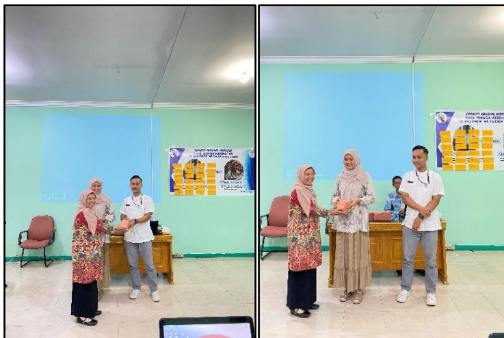
Gambar 3. Pemateri Menyerahkan hadiah kenangan kepada peserta

Secara keseluruhan, kegiatan berjalan lancar, semua peserta yang hadir mengikuti kegiatan dari awal sampai akhir. Peserta yang hadir sangat antusias dan aktif selama penyampaian materi dan praktek dilakukan. Selanjutnya pada Gambar 3 pemateri menyerahkan hadiah kenangan