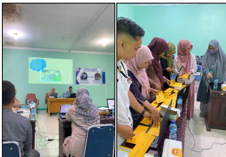
Gambar 2. Tim PKM menyampaikan materi

Pada awal kegiatan acara di buka oleh MC, yang bertindak sebagai Mc adalah anggota PKM yaitu mahasiswa selanjutnya tim PKM memperkenalkan diri dan menyampaikan materinya masing masing, kemudian setelah itu memberikan penjelasan sedikit tentang pengabdian masyarakat yang dilakukan oleh tim hibah PKM Apikes Iris, kemudian TIM PKM menyampaikan materi untuk menjelaskan pentingnya Communicative Competence bahasa inggris bagi Perekam Medis dan Informasi Kesehatan (PMIK) Di RSJ HB Saanin Padang seperti yang terlihat pada Gambar 2.