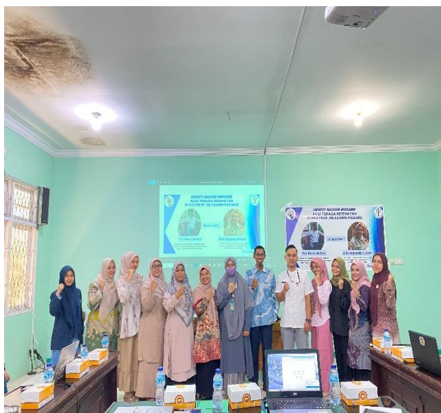
Gambar 4. Foto bersama sesaat setelah acara PKM berakhir

Pada kegiatan ini para petugas PMIK di RSJ HB Saanin Padang sangat antusias untuk mendengarkan dan menerima materi yang disampaikan oleh Ketua pengabdian. Selama penyampaian materi peserta PKM merespon materi yang diberikan oleh ketua pengabdian dengan baik, walaupun pada saat ditanya mengenai beberapa pengucapan untuk alphabet bahasa inggris masih ada yang belum tau atau ragu-ragu dalam pelafalannya. Pada pemberian tugas menyusun beberapa kata menjadi sebuah kalimat yang baik pada umumnya petugas PMIK sudah mampu untuk menyusun beberapa kata menjadi sebuah kalimat yang baik diberikan oleh ketua pengabdian. Petugas PMIK di RSJ. HB Saanin Padang pada umumnya lumayan telah mempunyai kemampuan dasar dalam bahasa inggris, walaupun masih ada beberapa yang perlu diberikan penjelasan lebih lanjut. Berikut foto bersama setelah acara berakhir seperti pada gambar 4.