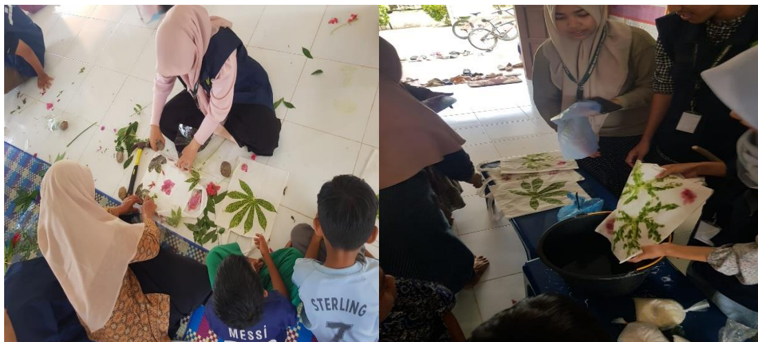
Gambar 2. Pelaksanaan Pelatihan Ecoprint