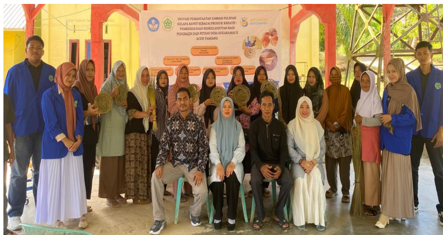
Gambar 3. Pelaksanaan pengabdian bersama mitra dan perangkat desa.

Program ini mendapat dukungan penuh dari perangkat Desa Sukaramai Dua dan tokoh masyarakat setempat dapat dilihat pada Gambar 3 . Dukungan ini penting untuk memastikan keberlanjutan kegiatan pasca-pendampingan. Sinergi antara perguruan tinggi, masyarakat, dan pemerintah desa diharapkan mampu menciptakan model pemberdayaan yang dapat direplikasi di desa lain dengan potensi serupa.