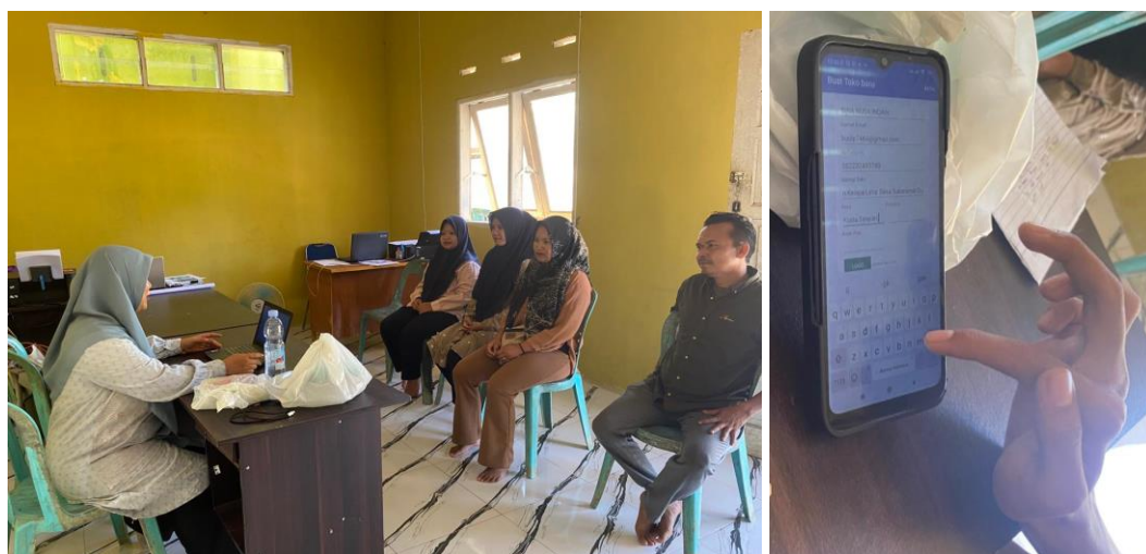
Gambar 6. Bimbingan manajemen usaha

Observasi awal menunjukkan kelompok mitra belum memiliki sistem pembukuan dan pencatatan biaya terstruktur. Melalui pelatihan manajemen usaha, mitra dibekali keterampilan menghitung harga pokok penjualan (HPP), membuat laporan keuangan sederhana, serta mengelola modal usaha. Peningkatan kemampuan ini diharapkan menciptakan tata kelola usaha yang transparan, efisien, dan berorientasi pada pertumbuhan berkelanjutan. Proses pembimbing manajemen usaha dapat didokumentasi pada Gambar 6 .