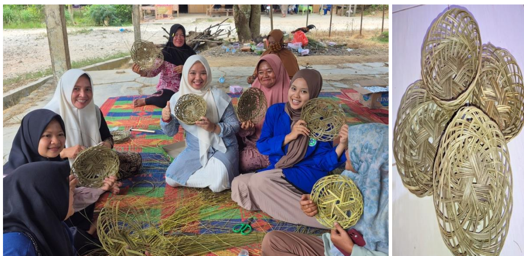
Gambar 5. Produk kerajinan dari lidi sawit

Pendampingan difokuskan pada tiga aspek utama: