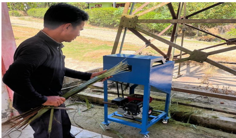
Gambar 4. Proses pengoperasi alat teknologi tepat guna

Sebelum intervensi, proses perautan lidi dilakukan secara manual, dengan kapasitas rata-rata hanya 3 kg/orang/hari dan mutu produk yang tidak seragam. Melalui penerapan alat peraut lidi sawit otomatis, kapasitas produksi diproyeksikan meningkat signifikan menjadi \pm 10-15 kg/orang/hari. Peningkatan ini tidak hanya mempercepat proses produksi, tetapi juga menghasilkan lidi dengan ukuran seragam, sehingga meningkatkan nilai jual dan daya saing di pasar. Pelatihan teknis diberikan untuk memastikan seluruh anggota kelompok dapat mengoperasikan dan merawat alat secara mandiri. Dokumentasi kegiatan dipengoperasian alat teknologi dapat dilihat pada Gambar 4 .