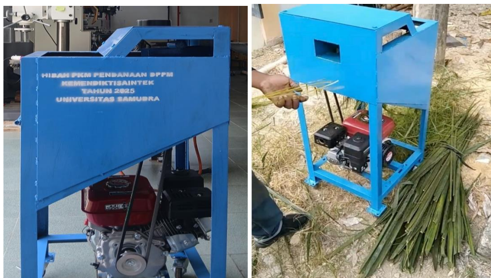
Gambar 2. Alat teknologi tepat guna

Teknologi tepat guna yang digunakan adalah alat peraut lidi sawit otomatis yang dirancang untuk meningkatkan kapasitas produksi dan kualitas hasil. Alat ini disediakan oleh tim pengabdian dan diinstalasi di lokasi produksi kelompok mitra. Tim juga memberikan panduan teknis penggunaan dan perawatan alat agar dapat dioperasikan secara berkelanjutan. Alat teknologi tepat guna dapat dilihat pada Gambar 2 .