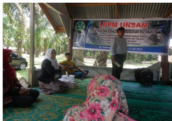
Gambar 2. Tim Pengabdian memberikan Penyuluhan kepada Warga untuk Program Pemberdayaan masyarakat

organisasi sederhana ini dengan dibentuk kelompok sadar wisata, dan pelatihan wirausaha yang kreatif dan inovatif.