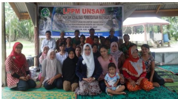
Gambar 3. Diskusi setelah diberikan Penyuluhan