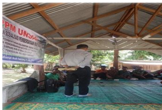
Gambar 1. Tim Pengabdian menyampaikan maksud dan tujuan kegiatan disertai diskusi