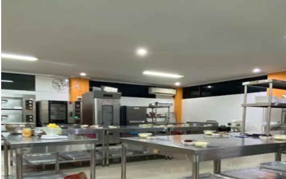
Gambar 3. Lokasi Pelatihan Pembuatan Roti Buaya

Pelatihan ini difasilitasi oleh mahasiswa PPG Calon Guru Gelombang 2 Tahun 2024 dari berbagai bidang keahlian, seperti kuliner, busana, kecantikan dan SPA, serta manajemen perkantoran dan layanan bisnis. Keberagaman latar belakang keahlian para fasilitator memberikan nilai tambah karena materi disampaikan secara menyeluruh dan sesuai kebutuhan peserta. Khususnya, mahasiswa bidang kuliner memandu peserta secara rinci dalam proses pembuatan Roti Buaya, mulai dari pemilihan bahan, pengolahan adonan, hingga teknik pengovenan, dekorasi roti sesuai tradisi Betawi dipandu oleh mahasiswa bidang Kecantikan dan SPA, Labelling dipandu oleh mahasiswa Busana serta E-commerce dipandu oleh mahasiswa Manajemen Perkantoran dan Layanan Bisnis. Pendampingan langsung ini membantu peserta mengatasi kendala teknis dan meningkatkan kepercayaan diri dalam menghasilkan produk berkualitas. Dokumentasi dari kegiatan pemberian materi dapat dilihat pada gambar 4.