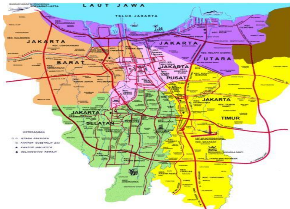
Gambar 1. Peta Mitra Pelatihan Pembuatan Roti Buaya

Pelaksanaan pelatihan dilakukan oleh mahasiswa PPG Calon Guru Gelombang 2 Tahun 2024 Bidang Vokasi yang berasal dari berbagai bidang keahlian, seperti Kuliner, Busana, Kecantikan dan SPA, serta Manajemen Perkantoran dan Layanan Bisnis yang telah dibekali dengan pengetahuan dan keterampilan terkait materi pelatihan sehingga mampu menyampaikan materi secara efektif dan membantu peserta dalam praktik pembuatan roti buaya. dapat dilihat pada peta kota Jakarta di gambar 1