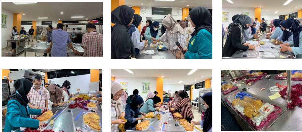
Gambar 5. Pelatihan Pembuatan Roti Buaya