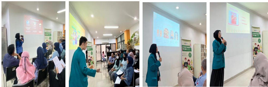
Gambar 4. Penyampaian Materi kepada Peserta Pelatihan

Pelatihan ini difasilitasi oleh mahasiswa PPG Calon Guru Gelombang 2 Tahun 2024 dari berbagai bidang keahlian, seperti kuliner, busana, kecantikan dan SPA, serta manajemen perkantoran dan layanan bisnis. Keberagaman latar belakang keahlian para fasilitator memberikan nilai tambah karena materi disampaikan secara menyeluruh dan sesuai kebutuhan peserta. Khususnya, mahasiswa bidang kuliner memandu peserta secara rinci dalam proses pembuatan Roti Buaya, mulai dari pemilihan bahan, pengolahan adonan, hingga teknik pengovenan, dekorasi roti sesuai tradisi Betawi dipandu oleh mahasiswa bidang Kecantikan dan SPA, Labelling dipandu oleh mahasiswa Busana serta E-commerce dipandu oleh mahasiswa Manajemen Perkantoran dan Layanan Bisnis. Pendampingan langsung ini membantu peserta mengatasi kendala teknis dan meningkatkan kepercayaan diri dalam menghasilkan produk berkualitas. Dokumentasi dari kegiatan pemberian materi dapat dilihat pada gambar 4.