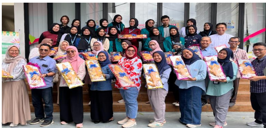
Gambar 6. Peserta dan Panitia Pelatihan Pembuatan Roti Buaya