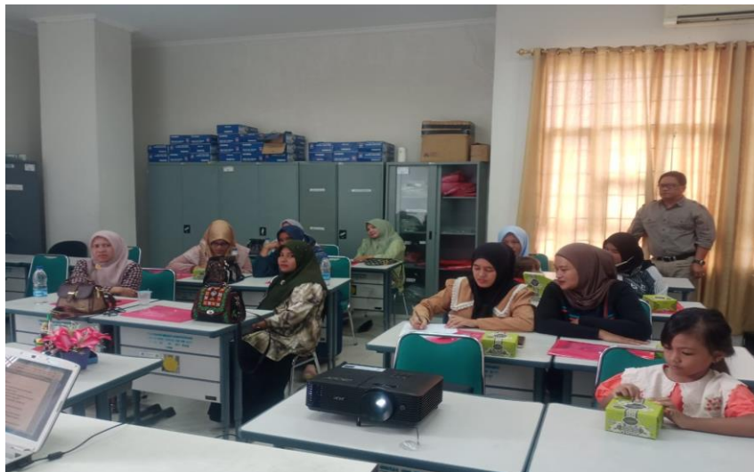
Gambar 5. Peserta sedang melakukan pendalaman materi di bimbing instruktur

Pada sesi kedua pelatihan peserta teknis bagaimana mengelola keuangan digital dengan baik, dalam sesi ini mulai pengenalan transaksi bisnis, proses mencatat/jurnal, pemahaman tentang debit/kredit, membuat buku besar sampai menyusun laporan keuangan yaitu laporan Laba Rugi dan laporan Posisi Keuangan. Pada tahap penyusunan laporan keuangan peserta diberi pengetahuan mengenai unsur-unsur dari laporan keuangan yang disusun, mulai pemahaman aset, utang dan modal sampai pendapatan dan beban dari aktifitas perusahaan/ usaha.