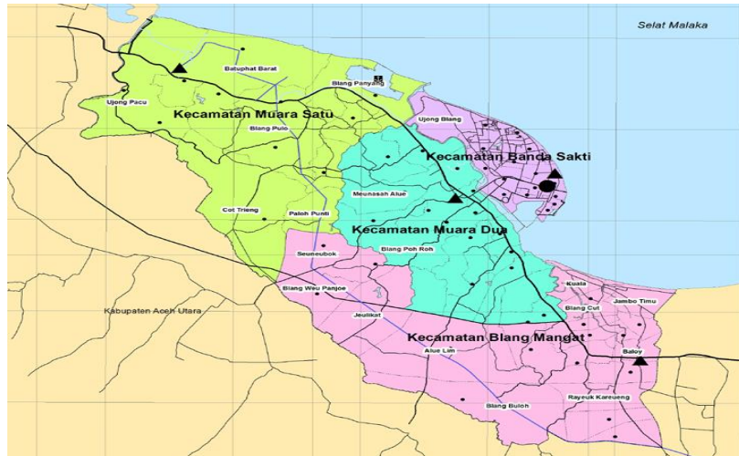
Gambar 2. Peta Mitra Pelatihan

Politeknik Negeri Lhokseumawe yang terletak pada jalan Medan - Banda Aceh No.Km. 280, Buketrata, Masjid Punteut, Kec. Blang Mangat, Kota Lhokseumawe, sangat dekat dengan jarak responden pengabdian, hanya berjarak 9,6 KM yang dapat ditempuh dalam waktu 15 menit berkendara, ini sangat penting diketahui, supaya sosialisasi yang akan dilaksanakan ada di kampus Politeknik Negeri Lhokseumawe sehingga para peserta pelatihan tidak telambat dan kesulitan untuk menuju ketempat pelatihan. Berikut ini ditampilkan peta lokasi mitra sasaran yang menjadi target.