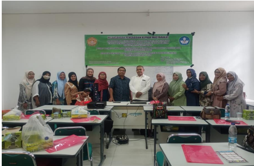
Gambar 3. Peserta dan instruktur pelatihan

Pelatihan dimulai dengan melakukan pretest bagi seluruh peserta dengan mengisi kuesioner yang tersedia, hal ini dilakukan untuk menilai tingkat pemahaman peserta tentang materi yang dilatih. Dari hasil jawaban pretest yang dilaksanakan diperoleh hasil dimana sebagian peserta masih belum paham tentang mengenai pengelolaan keuangan digital, ini dapat diidentifikasi dari peserta belum mempunyai pengetahuan maupun kemampuan menyusun laporan keuangan digital, pengetahuan peserta diawal pelatihan masih sangat terbatas mengenai penting pelaporan keuangan, pelaku UMKM bahkan tidak pernah membuat laporan keuangan sehingga UMKM tidak mengetahui kemajuan usahanya.