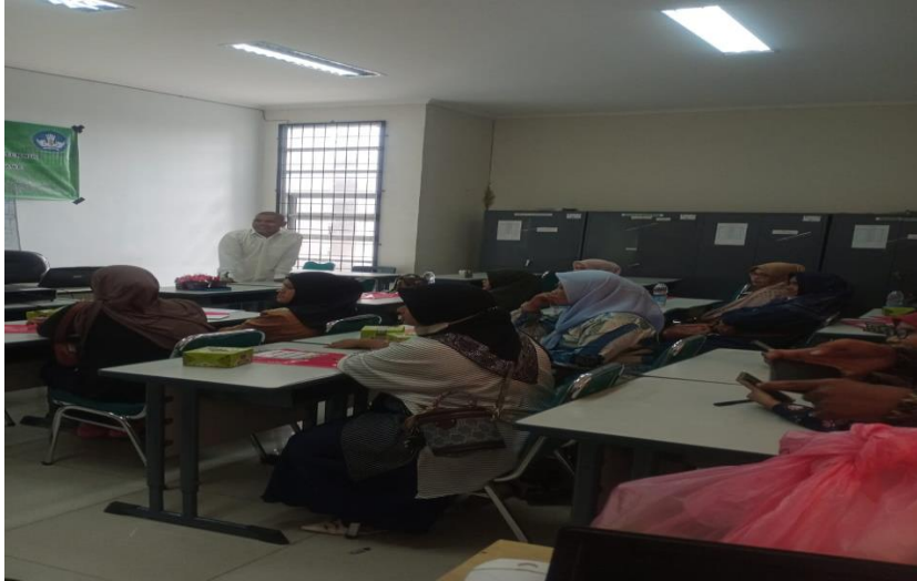
Gambar 6. Peserta mengikuti postest

Hambatan yang dihadapi selama pelaksanaan pelaksanaan pelatihan pengelolaan keuangan digital dengan aplikasi microsoft access adalah waktu yang relatif singkat, ada beberapa peserta masih terkendala dalam hal penjurnalan terhadap transaksi yang timbul, peserta masih sulit memahami debit kredit serta ditemukan banyak peserta sulit memisahkan kepentingan pribadi dengan perusahaan sehingga mereka masih mencampur adukkan uang pribadi dengan uang usahanya, akibatnya pada saat menyusun laporan keuangan terasa sulit terwujud.