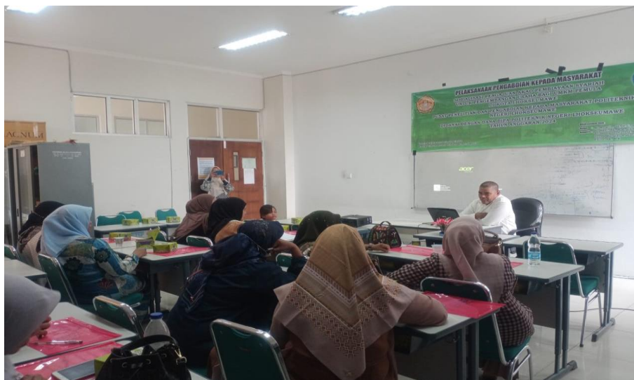
Gambar 4. Peserta pelatihan sedang mengikuti pretest

Pelatihan dimulai dengan melakukan pretest bagi seluruh peserta dengan mengisi kuesioner yang tersedia, hal ini dilakukan untuk menilai tingkat pemahaman peserta tentang materi yang dilatih. Dari hasil jawaban pretest yang dilaksanakan diperoleh hasil dimana sebagian peserta masih belum paham tentang mengenai pengelolaan keuangan digital, ini dapat diidentifikasi dari peserta belum mempunyai pengetahuan maupun kemampuan menyusun laporan keuangan digital, pengetahuan peserta diawal pelatihan masih sangat terbatas mengenai penting pelaporan keuangan, pelaku UMKM bahkan tidak pernah membuat laporan keuangan sehingga UMKM tidak mengetahui kemajuan usahanya.