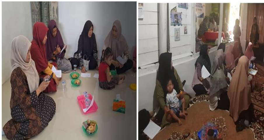
Gambar 3. Monitoring dan evaluasi kegiatan dengan mengedarkan angket dan wawancara dengan masyarakat.

Salah satu aspek yang menarik dari program ini adalah adanya minat dari beberapa peserta pelatihan untuk mengembangkan usaha biobriket sebagai sumber pendapatan tambahan. Monitoring dan evaluasi terhadap kegiatan terkait pemahaman tentang pembuatan biobriket dilakukan dengan mengedarkan angket dan wawancara dengan masyarakat (gambar 3). Dalam beberapa bulan setelah pelatihan, beberapa kelompok masyarakat mulai memproduksi biobriket dalam skala kecil dan menjualnya ke pasar lokal. Hal ini menunjukkan bahwa produksi biobriket tidak hanya menjadi solusi untuk masalah limbah, tetapi juga membuka peluang ekonomi baru bagi masyarakat, terutama bagi kelompok ibu rumah tangga dan pemuda desa yang ingin berwirausaha. Dengan semakin meningkatnya permintaan akan energi alternatif yang lebih ekonomis dan ramah lingkungan, peluang usaha biobriket berpotensi menjadi salah satu sektor bisnis yang dapat berkembang pesat di masa mendatang [10].