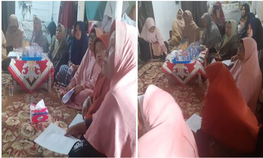
Gambar 1. Sosialisasi pembuatan briobriket pada masyarakat Desa Cot Mesjid

biobriket secara mandiri, potensi pengembangan home industry, dan efektivitas biobriket sebagai bahan bakar alternatif. Kegiatan sosialisasi pembuatan briobriket pada masyarakat Desa Cot Mesjid ditampilkan pada gambar 1