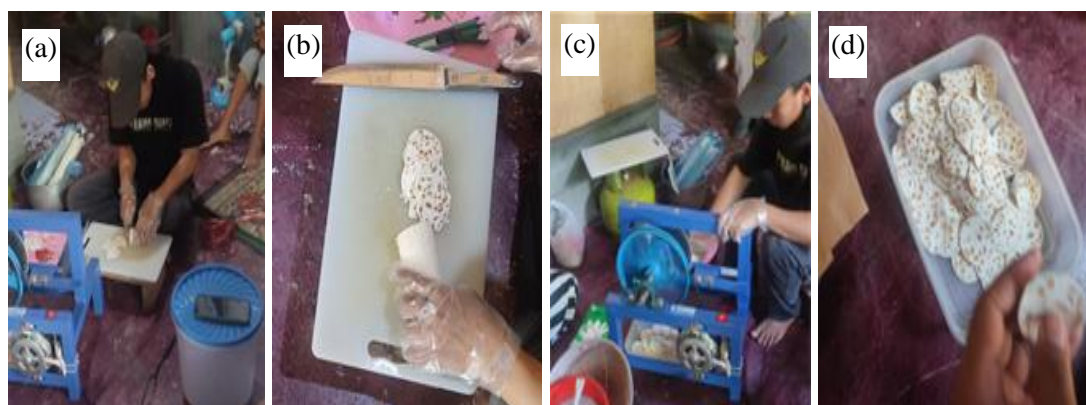
Gambar 4. Perbandingan iris manual dan iris mesin (a) iris manual, (b) hasil iris manual, (c) iris mesin, dan (d) hasil iris mesin

Perbandingan iris manual dengan iris pakai mesin. Mesin pengiris tempe yang akan dihibahkan kepada mitra pengabdian memang masih harus dioperasikan oleh operator untuk menggerakkan pengumpan yang berisi potongan tempe batangan ke mata pengiris yang digerakkan oleh motor listrik. Sekalipun demikian, mesin pengiris keripik tempe ini tetap jauh lebih efektif dibandingkan jika harus mengiris secara manual dengan menggunakan pisau dan telenan. Untuk membuktikan hal ini, tim PKM kemudian menguji dan membandingkan kedua metode pengirisan keripik tempe oleh mitra. Metode yang diterapkan dalam proses pengujian ini serupa dengan metode yang digunakan oleh tim PKM sebelumnya dalam pengujian mesin perajang bawang dan kegiatan pengabdian lain yang serupa [17,18]. Dalam pengujian mitra akan diminta untuk mengiris bahan baku tempe batangan selama 30 detik baik secara manual (Gambar 4(a)) ataupun dengan menggunakan mesin pengiris keripik tempe (Gambar 4(c)).