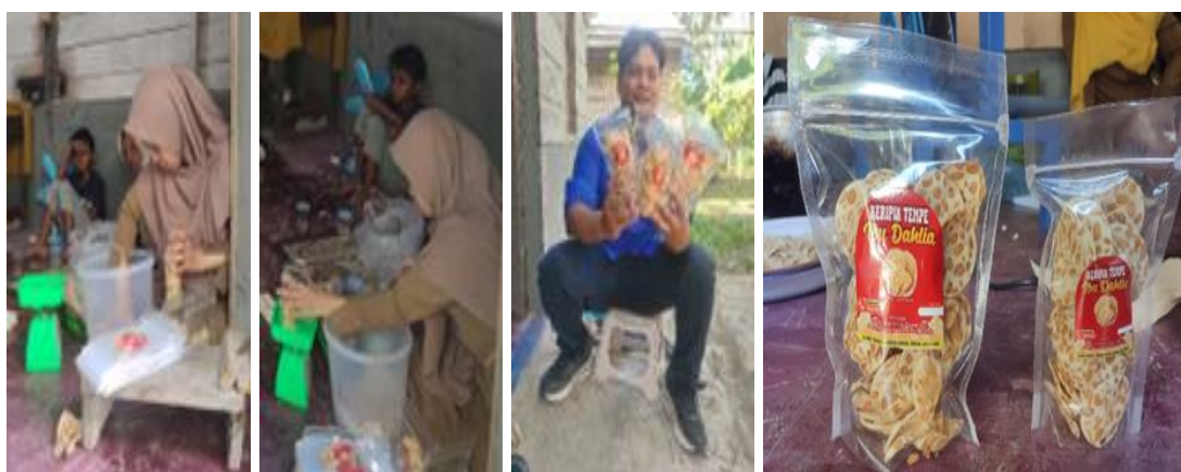
Gambar 6. Pengemasan keripik tempe

Pengemasan keripik tempe. Setelah didiamkan beberapa saat di atas talam hingga kadar minyak menurun, keripik tempe kemudian dimasukkan ke dalam toples untuk menjaga agar tetap garing. Keripik tempe kemudian dikemas ke dalam kemasan yang telah dibeli label kemasan. Proses pengemasan dilakukan dengan menimbang berat dari keripik tempe dalam kemasan. Setelah beratnya pas sesuai dengan label, seal dari kemasan kemudian ditutup dan