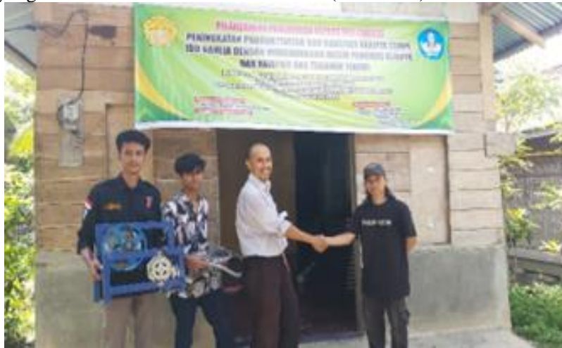
Gambar 7. Serah terima alat dengan anak dari mitra kegiatan pengabdian

Serah terima alat. Setelah seluruh agenda kegiatan pengabdian masyarakat keripik tempe selesai dilaksanakan yang meliputi, pengujian mesin, pemantauan kegiatan oleh tim pemantau P3M, pelatihan mitra dalam menggunakan mesin dan pengenalan kemasan produk, kegiatan pengabdian masyarakat oleh tim PKM ditutup dengan proses serah terima alat ke mitra pengabdian yang diwakili oleh anak dari Ibu Dahlia (Gambar 7).