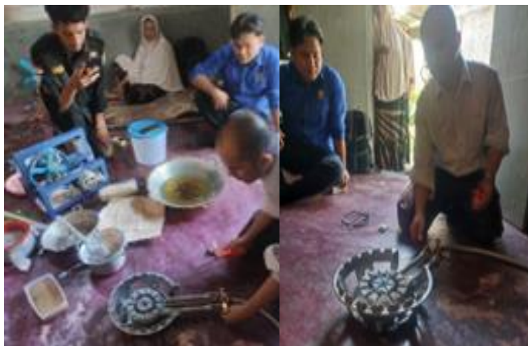
Gambar 5. Ketua tim PKM sedang memperagakan cara menghidupkan kompor gas tekanan tinggi dan cara pengaturan apinya

Walaupun kompor yang dihibahkan ke mitra tidak memiliki pemantik api dan harus menggunakan pemantik eksternal, kompor gas ini sangat efektif digunakan untuk menggoreng keripik tempe karena pengaturan apinya sangat lengkap dengan tiga buah tombol pengaturan api yang berbeda. Seperti yang terlihat pada Gambar 5, ketua tim PKM sedang mendemonstrasikan cara mengoperasikan kompor gas tekanan tinggi yang akan dihibahkan.