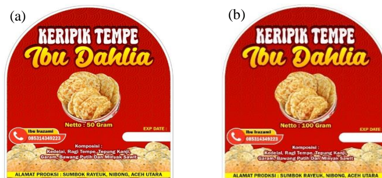
Gambar 3. Label kemasan (a) kemasan kecil 50 gr dan (b) kemasan besar 100 gr

Kemasan Keripik Tempe. Tim PKM melakukan survey mengenai jenis dan ukuran kemasan yang digunakan oleh penjual keripik tempe dalam pemasaran produknya. Hasil survey menunjukkan kemasan yang sering digunakan adalah kemasan tipe standing pouch ukuran medium yang ketika diisi produk keripik tempe akan memiliki bobot sekitar 100 gr. Produk keripik tempe yang dikemas dengan ukuran kemasan ini biasanya dijual dengan harga sekitar Rp. 10.000 – Rp. 15.000.