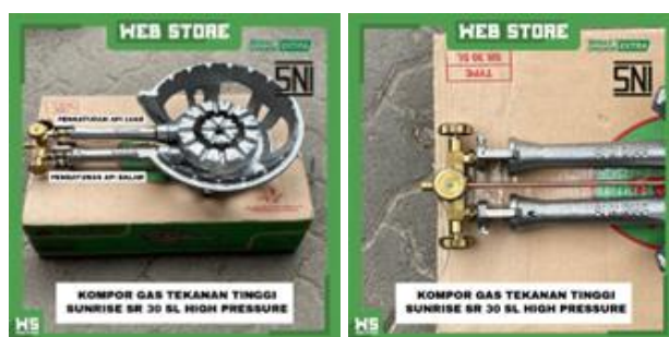
Gambar 2. Kompore gas tekanan tinggi dengan katub pengatur api dalam dan api luar

Porawati dan Kurniawan [9] merancang dan membuat mesin pengiris yang serupa dengan Jhodi et al. [7]. Gerakan bolak-balik dari proses pengumpanan bahan baku tempe batangan ke piringan pemotong dicapai dengan mekanisme poros engkol. Ketebalan irisan diatur dengan stopper dan batangan tempe ditekan dengan pegas sehingga bisa teriris sampai habis. Ketebalan rata-rata hasil pengirisan dari alat mereka adalah sekitar 2 mm. Desain dari mesin pengiris keripik tempe yang dikerjakan oleh Imansyah et al. [10] agak sedikit berbeda dengan yang lain. Mereka menggunakan piringan pemotong untuk mengiris keripik tempe namun diposisikan dalam arah horizontal. Batangan tempe diletakkan dalam kotak ketika diumpankan ke piringan pemotong. Kotak pengumpan bergerak bolak-balik secara otomatis seperti mesin pengiris dari Porawati dan Kurniawan [9]. Namun gerakan bolak-baliknya terjadi karena kotak dihubungkan dengan poros piringan pemotong dengan menggunakan tuas penghubung. Mesin pengiris keripik tempe yang paling canggih yang ditemukan dalam literatur mungkin adalah mesin yang didesain oleh Alfauzi et al. [11]. Mesin mereka mirip dengan mesin yang dibuat oleh Poorawati dan Kurniawan [9] dimana mereka menggunakan piringan pemotong vertikal dengan pengumpanan batangan tempe secara otomatis. Hanya saja mesin mereka menggunakan dua buah jalur pengumpanan batangan tempe dengan kapasitas pengirisan yang lebih besar yaitu sekitar 20 kg/jam.