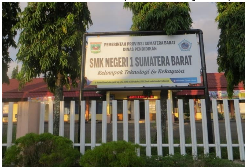
Gambar 1. Foto halaman depan SMKN 1 Sumbar