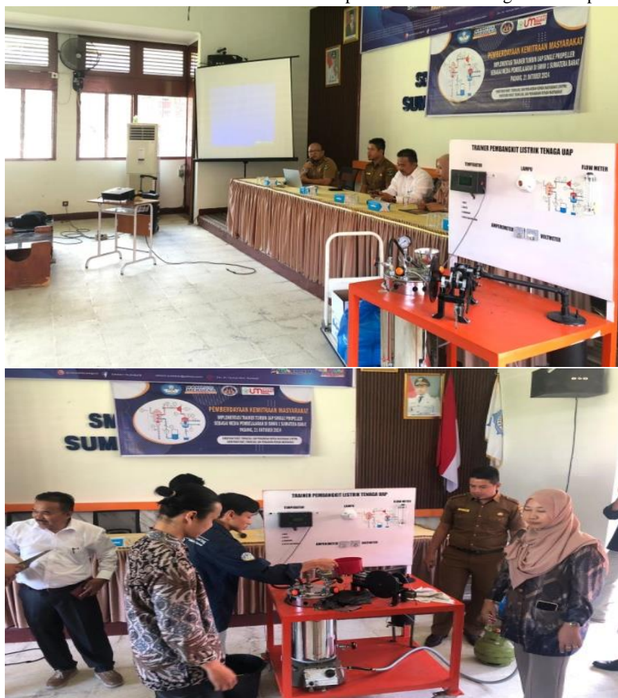
Gambar 6. Sosialisasi pengenalan trainer pembangkit listrik tenaga uap

Selain pengenalan teknis, sosialisasi juga mencakup panduan perawatan dasar yang harus dilakukan secara rutin. Pihak mitra diberikan pelatihan dalam pembersihan komponen utama, pengecekan koneksi, serta pemeriksaan fungsi kontrol dan indikator. Langkah-langkah ini penting untuk menjaga agar trainer tetap berada dalam kondisi optimal, serta memperpanjang masa pakainya. Antusiasme siswa dan guru terlihat selama sesi tanya jawab, di mana mereka menunjukkan minat tinggi terhadap prinsip-prinsip kerja PLTU dan prosedur operasional trainer. Melalui interaksi langsung, diharapkan Trainer PLTU ini menjadi media pembelajaran yang aktif dan menarik bagi siswa, bukan sekadar alat bantu sesaat. Guru-guru yang turut dilatih diharapkan mampu menjadi mentor dalam kegiatan praktikum ke depan, sehingga penggunaan trainer ini dapat terintegrasi ke dalam kurikulum praktikum dan meningkatkan kualitas pembelajaran di sekolah.