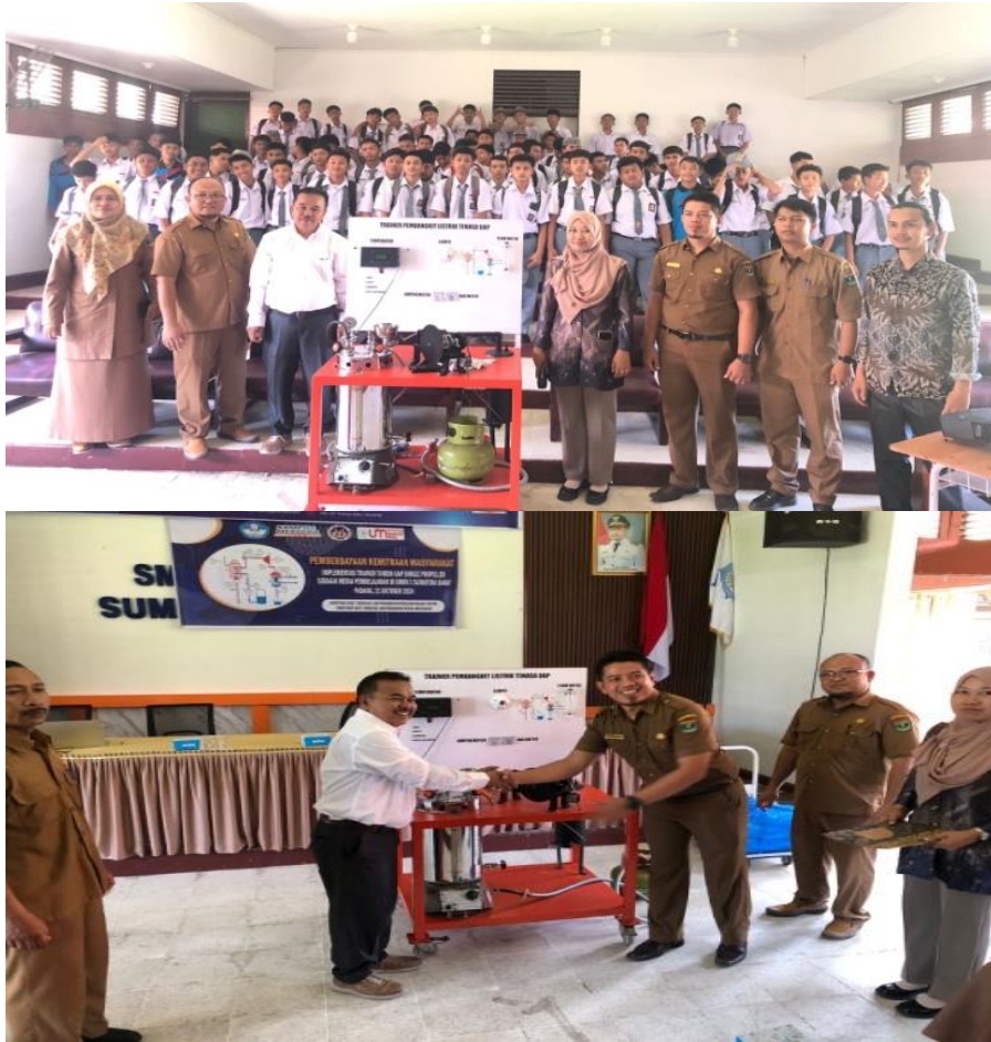
Gambar 5. Pembukaan kegiatan tim PKM dengan sekolah mitra

Acara sosialisasi dimulai dengan penjelasan rinci mengenai setiap komponen Trainer PLTU, seperti turbin, boiler, kondensor, dan sistem kontrol. Tim PKM memberikan penjelasan terperinci tentang fungsi dan peran masing-masing komponen dalam keseluruhan sistem pembangkit. Dengan pemahaman ini, siswa dan guru dapat melihat secara langsung bagaimana prinsip kerja PLTU direpresentasikan melalui trainer. Tahap ini diikuti oleh panduan operasional dan langkah-langkah keselamatan dalam penggunaan alat, yang meliputi pengecekan awal komponen, pengaturan suhu, dan pemanfaatan fitur interaktif. Foto kegiatan pengenalan trainer turbin uap dapat dilihat pada Gambar 6.