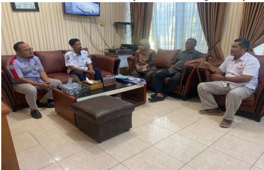
Gambar 2. Kunjungan tim pengusul PKM ke sekolah mitra

Dalam upaya meningkatkan minat dan pemahaman siswa tentang energi terbarukan, perlu diterapkan metode pembelajaran yang lebih menarik dan praktis. Berdasarkan penelitian [5], salah satu pendekatan yang efektif adalah dengan memanfaatkan media pembelajaran simulasi [6], seperti penggunaan trainer. Penggunaan trainer dalam pembelajaran, memungkinkan siswa dapat mengalami secara langsung konsep-konsep energi terbarukan, menciptakan pengalaman praktik yang dapat meningkatkan pemahaman mereka dan merangsang minat terhadap bidang ini. Dengan simulasi ini, siswa dapat terlibat aktif dalam proses pembelajaran, memahami secara nyata bagaimana teknologi energi terbarukan bekerja, dan melibatkan diri dalam eksplorasi keterampilan praktis yang diperlukan di dunia kerja [7], [8]. Pernyataan ini sejalan dengan hasil penelitian dari tim pengusul mengenai penerapan trainer sebagai media pembelajaran interaktif. Hasil penelitian tersebut menyatakan bahwa penggunaan media pembelajaran berbasis situasi nyata dapat meningkatkan minat siswa [9]. Penelitian lain juga menemukan bahwa penggunaan trainer sebagai media pembelajaran di SMKN 1 Losarang, khususnya di jurusan teknik otomotif, dapat meningkatkan kompetensi siswa hingga 20,5% [10]. Pengabdian ini merupakan hilirisasi dari penelitian ketua pengusul PKM, sehingga diharapkan dapat menjadi solusi berbasis riset untuk menyelesaikan permasalahan sekolah mitra dalam upaya meningkatkan mutu pembelajaran di SMKN 1 padang.