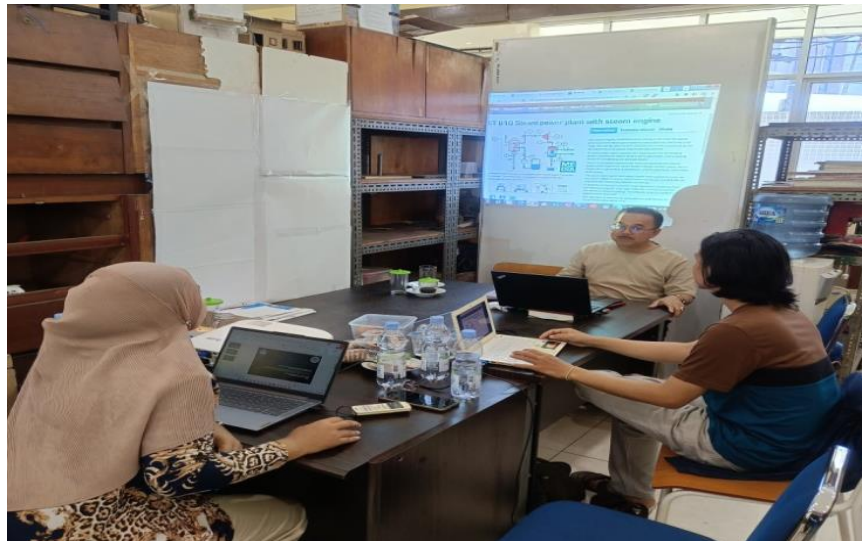
Gambar 4. Persiapan tim PKM dan penyamaan persepsi terkait pelaksanaan kegiatan

Sebagai hasil dari koordinasi dengan mitra, Trainer PLTU Single Propeller dirancang dengan mempertimbangkan tingkat pemahaman dan keterampilan siswa. Trainer ini dilengkapi dengan fitur monitoring dan elemen interaktif yang relevan untuk pembelajaran teknis, memberikan siswa pengalaman praktis dalam memahami proses pembangkitan tenaga listrik. Gambar 4 menunjukkan koordinasi tim PKM . Selain itu, pada tahap persiapan ini, seluruh anggota tim dipastikan memahami tujuan, metode, dan alur program sehingga mampu melaksanakan kegiatan dengan fokus dan komitmen tinggi. Kesiapan ini berdampak positif pada pelaksanaan tahap berikutnya.