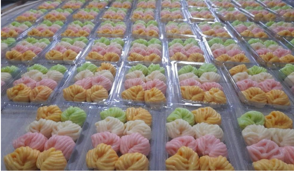
Gambar 3. Produk Getuk Lindri Mon Geudong Siap Dipasarkan

Keinginan untuk maju sangatlah besar. Harapan UMKM ini suatu hari nanti dapat menyewa toko agar produk-produknya dapat dikenali dan dijangkau oleh konsumen. Tidak hanya itu saja, pemilik usaha juga berkeinginan untuk membuat kemasan kue yang lebih elegan. Mencantumkan merek dan meletakkannya di etalase toko-toko kue. Saat ini kemasan getuk lindri hanya menggunakan plastik bening saja. Segala keinginan tersebut telah disampaikan kepada tim. Karena itu pula tim tergerak untuk memberdayakan UMKM ini. Tujuan kegiatan pengabdian masyarakat ini adalah untuk meningkatkan kapasitas dan kapabilitas mitra UMKM Getuk Lindri Mon Geudong dalam bidang produksi dan pemasaran berbasis online.