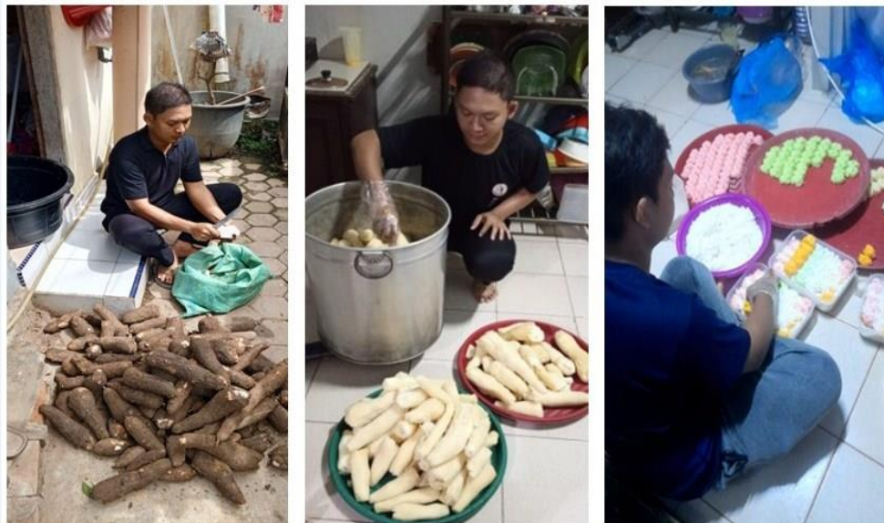
Gambar 2. Proses Produksi Getuk Lindri Mon Geudong

Terlihat pemanfaatan digital marketing online belum sepenuhnya dilakukan. Pemesanan lebih dominan berasal dari kenalan/kolega melalui pesan whats apps. Penggunaan media sosial lainnya seperti instagram, tik tok, dan facebook ads belum dilakukan. Padahal cara menyampaikan produk melalui media online sangat potensial untuk membantu meningkatkan omset penjualan (4). Apalagi rumah produksi getuk lindri ini merupakan satu-satunya pelaku tunggal di Lhokseumawe dan di Kabupaten Aceh Utara.