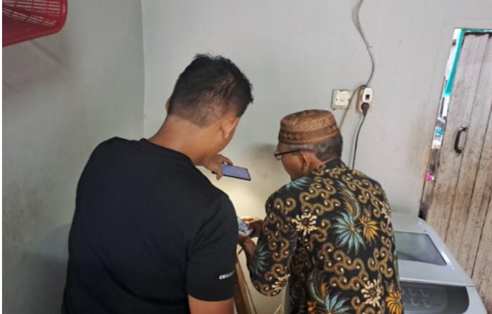
Gambar 5. Proses Pemeriksaan Mesin Produksi Getuk Lindri

Sistem dan proses produksi merupakan suatu hal yang perlu dikendalikan. Aspek manajemen produksi meliputi perencanaan produksi, pengendalian produksi, pengawasan produksi, dan waktu kapan bahan baku dipesan kembali ( economic order quantity ). Melakukan pengendalian agar memperoleh hasil yang maksimal misalnya dengan menyusun perencanaan dan menyusun jadwal kerja. Kemudian memastikan semua kegiatan berjalan sesuai dengan rencana misalnya produksi tepat waktu dan menetapkan kualitas dan standar produk.