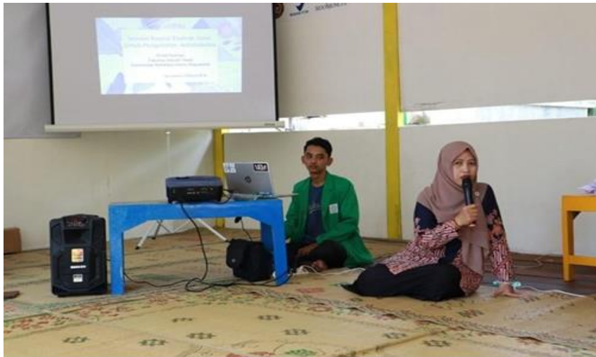
Gambar 1. Kegiatan Penyuluhan pelatihan kosmetik bahan alam pembuatan produk lilin aromaterapi Essensial Oil

Penyuluhan dilakukan dengan presentasi materi produk alat, bahan, identifikasi serta cara kerja. Kegiatan berlanjut dengan pemutaran vidio proses pembuatan guna memberikan pengetahuan mendalam terhadap pembuatan sehingga memudahkan dalam praktek pembuatan. Pemaparan materi dan pemutaran video dilaksanakan selama 15 menit. Kegiatan berjalan lancar dan peserta sangat antusias. Kegiatan penyuluhan dituangkan dalam gambar 1 di bawah ini.