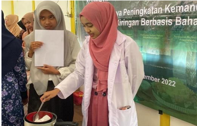
Gambar 2. Demonstrasi pembuatan produk