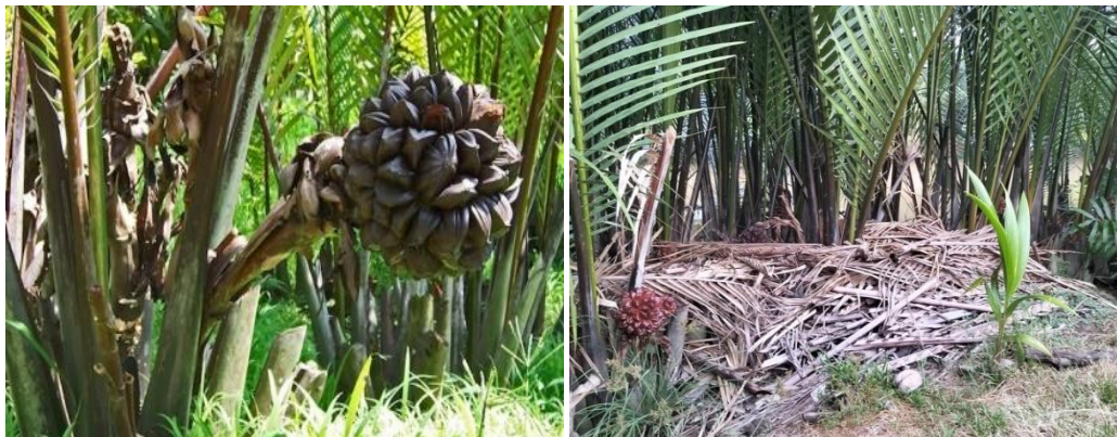
Gambar 2. Buah Tanaman Nipah ( Nypa fruticans )

Buah nipah berbentuk gepeng dengan 2-3 rusuk dengan warna coklat kemerah-merahan, terkumpul dalam kelompok rapat yang menyerupai bola berdiameter 13 cm. Struktur buah mirip dengan struktur buah kelapa, dengan eksokarp halus, mesokarp berupa sabut, dan endokarp keras yang disebut tempurung. Biji dilindungi oleh tempurung dengan panjang 8-13 cm dan berbentuk kerucut. Satu tandan buahnya mencapai 30-50 butir, berdempetan satu dengan yang lain membentuk kumpulan buah bundar (Gambar 2). Daging buah nipah mempunyai warna putih dan bentuk bulat seperti buah kolang kaling.