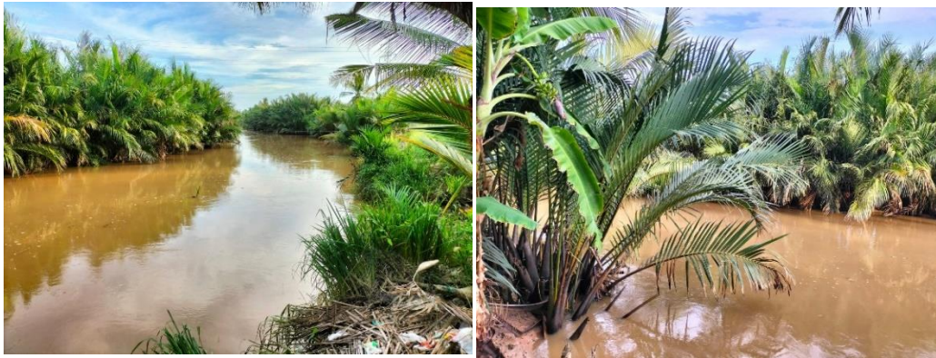
Gambar. 1. Tanaman Nipah di sepanjang bantaran sungai

Buah nipah berbentuk gepeng dengan 2-3 rusuk dengan warna coklat kemerah-merahan, terkumpul dalam kelompok rapat yang menyerupai bola berdiameter 13 cm. Struktur buah mirip dengan struktur buah kelapa, dengan eksokarp halus, mesokarp berupa sabut, dan endokarp keras yang disebut tempurung. Biji dilindungi oleh tempurung dengan panjang 8-13 cm dan berbentuk kerucut. Satu tandan buahnya mencapai 30-50 butir, berdempetan satu dengan yang lain membentuk kumpulan buah bundar (Gambar 2). Daging buah nipah mempunyai warna putih dan bentuk bulat seperti buah kolang kaling.