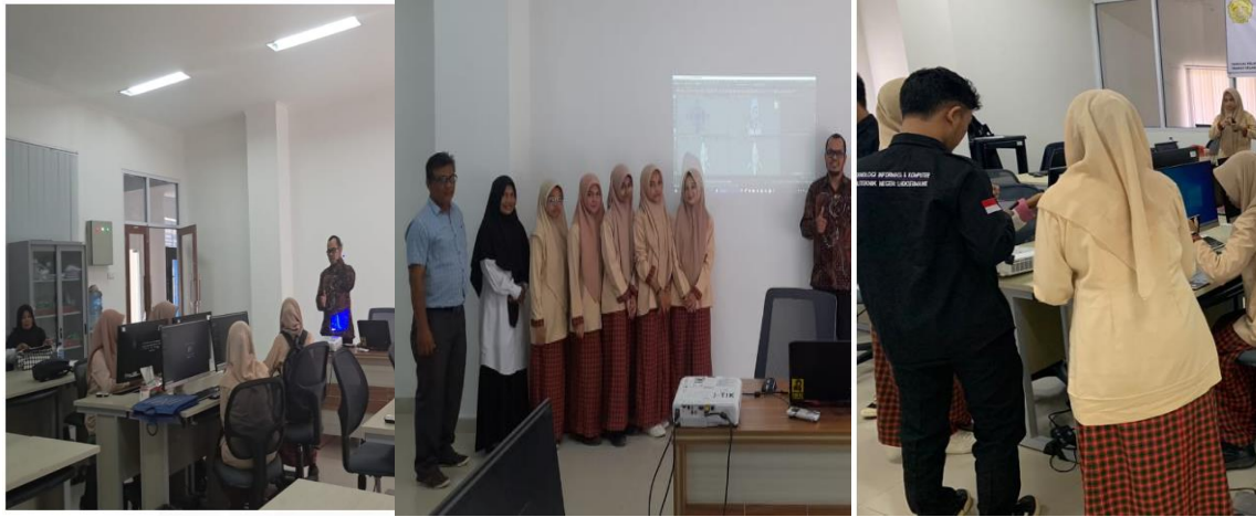
Gambar 1. Dokumentasi Kegiatan Pelatihan Hari Pertama

Photo-photo terkait pelaksanaan kegiatan mulai dari pembukaan sampai dengan pelaksanaan hari pertama ditampilkan pada Gambar 1.