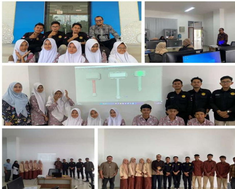
Gambar 2. Dokumentasi Kegiatan Pelatihan Hari Kedua dan Ketiga

Hal ini pertama ditunjukkan dengan keseriusan mereka mengikuti pelatihan dari awal sampai berakhirnya acara pelatihan, mulai dari pre-test , pemberian teori, pelaksanaan praktik dan post test dilakukan dengan benar dan serius. Dokumentasi kegiatan pelatihan hari kedua ditampilkan pada Gambar 2.