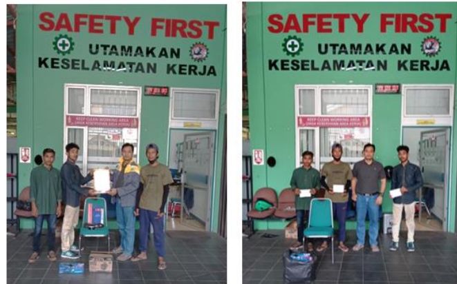
Gambar 3. Penyerahan mesin las dan alat bantu las ke peserta pelatihan