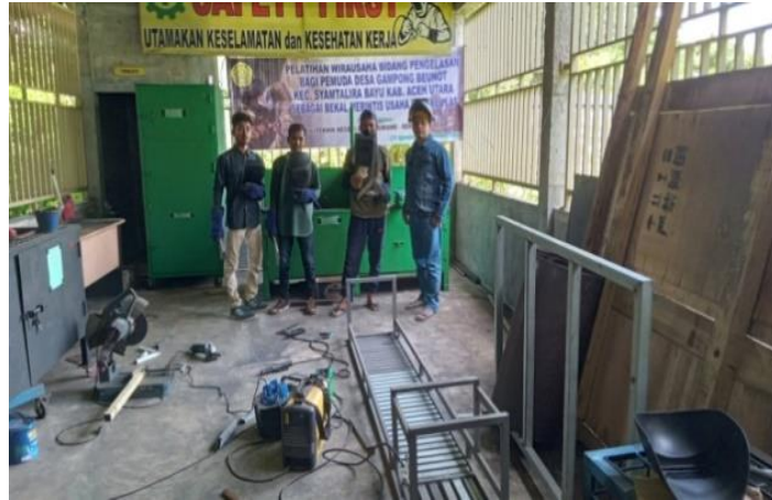
Gambar 6. Pesertabersama instruktur pelaksana bersiap melakukan praktik fabrikasi