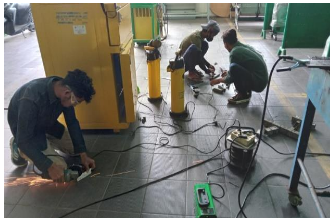
Gambar 5. Peserta pelatihan sedang melakukan praktik gerinda