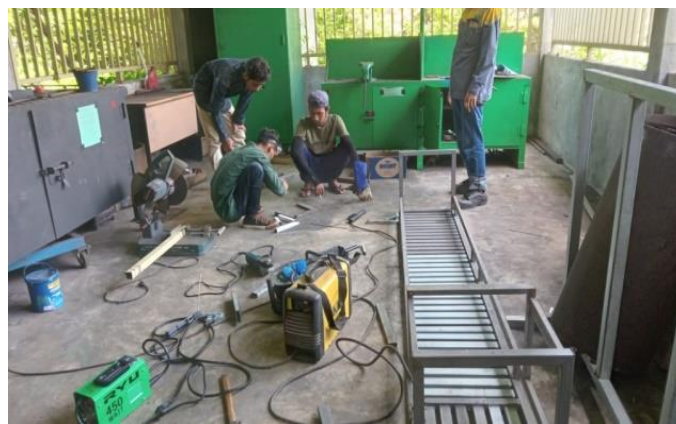
Gambar 7. Peserta pelatihan sedang melakukan pelatihan fabrikasi produk pengelasan.

Berdasarkan hasil evaluasi yang dilakukan terhadap kegiatan pelatihan ini, secara umum dapat dikatakan berhasil dengan baik. Keberhasilan program pelatihan ini dapat dilihat dari indikator sebagai berikut: