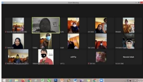
Gambar 4. Foto Bersama pada Pertemuan 3, Secara Offline dan Online