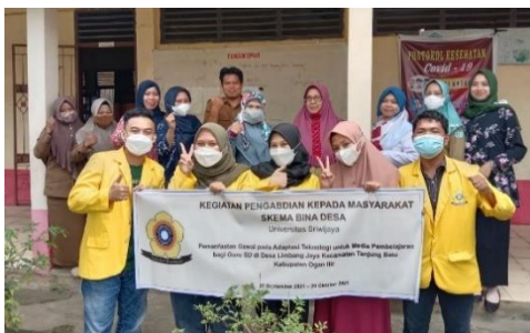
Gambar 5. Foto Bersama Setelah Kegiatan pada Pertemuan 4: Penutupan Kegiatan

Materi yang disampaikan pada pertemuan 1 diawali dengan pengenalan gawai sebagai pendukung proses pembelajaran, penggunaan WhatsApp , WhatsApp Group , WhatsApp Web , dan materi inti adalah penggunaan google form untuk membuat absensi kehadiran, membuat PR, dan soal-soal. Penjelasan materi google form diawali dengan memperkenalkan secara singkat tentang google form , lalu menjelaskan apa saja fitur dari google form yang dapat digunakan sebagai media yang mempermudah proses belajar mengajar selama daring. Selanjutnya dilakukan praktek menggunakan google form . Praktek pertama yaitu cara membuat absensi melalui google form , dan kemudian dilanjutkan dengan praktek membuat soal PR, tugas, atau ulangan dengan jenis tipe jawaban termasuk pilihan ganda dan cara menampilkan perhitungan score .