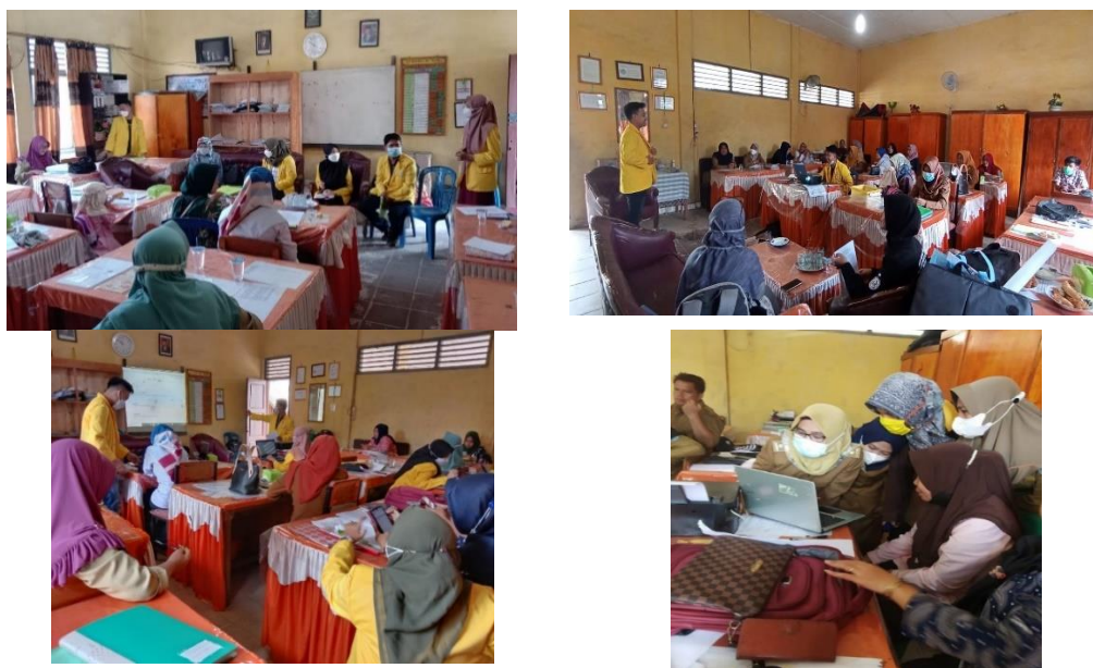
Gambar 1. Contoh Suasana Kegiatan pada Setiap Pertemuan: Penjelasan Materi dan Praktek

sebelum masa pandemi. Selain itu fasilitas mayoritas siswa untuk mengikuti pembelajaran secara daring masih cukup minim. Jika pembelajaran dengan tatap muka, respons (daya tangkap) siswa terhadap pelajaran lebih mudah diketahui. Lebih dari 80% mereka menyadari bahwa penggunaan gawai penting dalam proses pembelajaran. Ada 93% guru menjawab penting untuk meningkatkan kemampuan penggunaan teknologi gawai (HP, laptop, komputer, tablet) dalam mengajar. Hal ini menunjukkan antusias dan motivasi guru sangat tinggi untuk meningkatkan kemampuan mereka terhadap pemanfaatan gawai dalam proses pembelajaran. Para guru juga mayoritas berpendapat bahwa siswa SDN 9 dapat didorong menggunakan HP sebagai media untuk belajar, apalagi jika ada pendampingan dari orangtua dan guru.