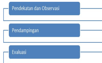
Gambar Alur Kegiatan Pengabdian

Pada tahap ini dinilai tingkat kerapian yang dibuat oleh peserta. Pada tahap ini tim pengabdian mengamati dan menilai proses pembuatan oleh setiap kelompok. Kriteria penilaian atau pun indikator pada pengabdian ini menjadi tolak ukur keberhasilan kegiatan pengabdian masyarakat ini. Secara singkat alur kegiatan pengabdian dapat dilihat pada bagan berikut.