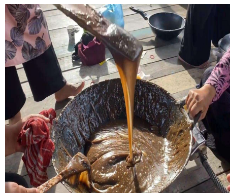
Gambar 4 Dodol Kopi yang Siap Dikemas