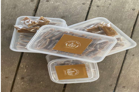
Gambar 5 Pengemasan Dodol Kopi e. Tahap Praktik Pemasaran Secara Online

Pada tahap ini, peserta telah selesai mengemas dodol kopi. Selain itu, peserta diajarkan menghitung modal dan laba yang akan dihasilkan. Modal yang digunakan untuk mempersiapkan bahan baku dodol kopi.