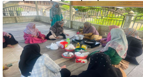
Gambar 4 Proses Memasak Dodol Kopi

Setelah bahan disusun dan disesuaikan dengan takaran, peserta mencampur bahan untuk dilakukan pengadukan bahan. Bahan yang sudah tercampur dimasukkan peserta ke dalam wajan untuk dimasak oleh peserta. Proses ini dilakukan peserta dengan semangat dan koperatif antar peserta. Berikut adalah gambar proses memasak dodol kopi sesuai panduan yang disiapkan pelaksana.