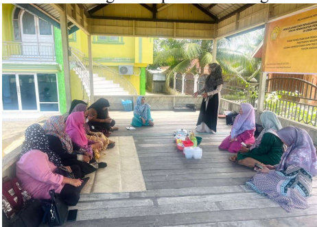
Gambar 2 Pembukaan Pengabdian Masyarakat

Berikut adalah gambar pembukaan kegiatan.