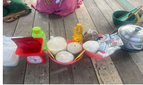
Gambar 3 Alat dan Bahan Pembuatan Dodol Kopi

Berikut adalah gambar bahan dan alat untuk membuat dodol kopi.