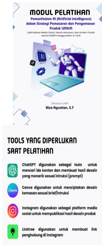
Gambar 1. Modul Pelatihan Pemanfaatan AI Tools dan Media Sosial

Seluruh kegiatan diikuti oleh 14 orang pelaku UMKM dari komunitas Ahad Festival Kota Lhokseumawe. Hasil sementara ini menjadi dasar dalam merumuskan langkah-langkah tindak lanjut untuk menyelesaikan kegiatan hingga mencapai 100% capaian luaran. Tingkat partisipasi pelatihan sangat tinggi, dibuktikan dengan kehadiran 100% dari 14 pelaku UMKM yang berasal dari berbagai jenis usaha seperti donat, ikan hias, jasa desain grafis, jualan/jahit baju, rajutan, henna, gorengan, batagor, jus buah dan coffee kemasan. Keberagaman ini menunjukkan bahwa materi pelatihan bersifat aplikatif lintas sektor dan dianggap relevan oleh seluruh peserta. Berikut adalah modul pelatihan yang digunakan: