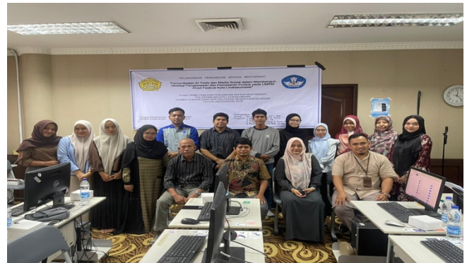
Gambar 3 Foto bersama tim pemantau dari P3M PNL