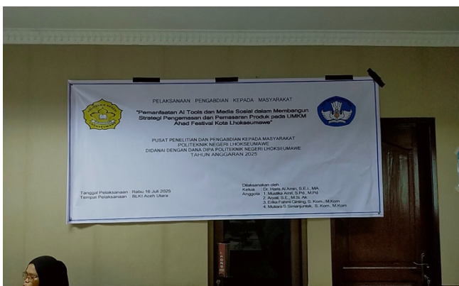
Gambar 1. Spanduk Kegiatan

Berikut dokumentasi foto kegiatan dan hasil disain produk yang telah dihasilkan.