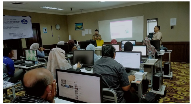
Gambar 2. Pelatihan sedang berlangsung