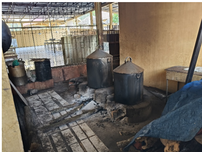
Gambar 2. Kondisi dapur Dayah Ar Raudhah yang masih menggunakan kayu sebagai bahan bakar utama dalam memasak makanan untuk para santri

berkelanjutan, baik berupa inovasi teknologi alternatif bahan bakar seperti biogas atau kompor hemat energi, maupun dukungan dari berbagai pihak dalam menyediakan bahan bakar yang ramah lingkungan dan mudah diakses. Dengan demikian, proses pendidikan dan pembinaan di Dayah Ar Raudhah dapat terus berjalan lancar tanpa terganggu oleh kendala operasional dapur