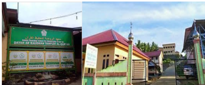
Gambar 1. Dayah Ar Raudhah Tahfizh Al Quran Lhokseumawe.

Dayah Ar Raudhah Tahfizh Al Quran di Lhokseumawe adalah sebuah pondok pesantren yang awal berdirinya khusus menerima santri yatim seiring perjalanan waktu Dayah ar Raudah sekarang sudah menerima santri non yatim. Ini menunjukkan bahwa pondok pesantren tersebut memberikan kesempatan bagi anak-anak yatim untuk belajar dan menghafal Al Quran serta mendapatkan pendidikan agama secara intensif. Hal ini dapat dianggap sebagai bentuk pelayanan sosial dan pendidikan yang penting bagi anak-anak yang kurang beruntung secara ekonomi atau sosial.