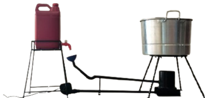
Gambar 4. Rancangan Kompor berbahan Oli Bekas dan minyak goreng bekas yang akan diterapkan di Dayah

Desain tungku mempertimbangkan aspek keselamatan, efisiensi panas, dan kemudahan perawatan. Apabila memungkinkan, tungku akan dilengkapi dengan sistem penyaringan asap sederhana untuk mengurangi dampak emisi.