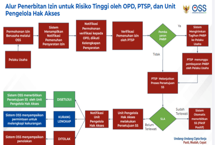
Gambar 1. Alur penerbitan izin

Penting untuk memastikan bahwa semua data yang diinputkan valid dan sesuai dengan kondisi usaha Anda. Jika ada kesulitan atau pertanyaan, Anda dapat berkonsultasi dengan petugas di Dinas Koperasi dan UKM setempat atau mengakses informasi lebih lanjut di laman web OSS.