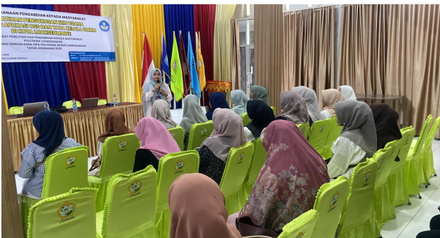
Gambar 2. Penyampaian materi pelatihan

Sosialisasi izin usaha tahap selanjutnya yang dibutuhkan bagi pelaku usaha yang memiliki latar belakang usaha kuliner dan usaha kue kering yang harus melanjutkan perizinan pada dinas Kesehatan dan BPOM.