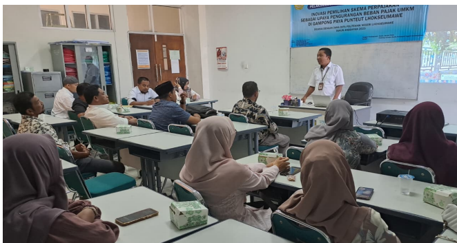
Gambar 2. Penguatan Mitra UMKM Lhokseumawe

Untuk memperoleh gambaran yang jelas, tim memberikan free test. Pertanyaannya berkisar pemahaman dasar manajemen dan produktivitas Semua sektor UMKM dipilih dalam kegiatan ini. Dari 9 orang peserta yang hadir, hanya 40% telah mengetahui pemahaman dasar pengelolaan bisnis UMKM. Selebihnya masih sangat awam. Informasi awal ini sangat penting untuk mempetakan kedudukan dan kemampuan UMKM sebelum proses penguatan berlangsung. Tim melihat secara jelas tingkat produktivitas dan pengelolaan manajemen sehingga diketahui bagaimana keunggulan dan keterbatasan yang dialami oleh UMKM.