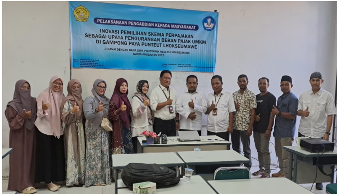
Gambar 1. Peserta UMKM bersama tim PKM PNL

Tim telah melaksanakan penguatan teknis inovasi pemilihan skema perpajakan sebagai upaya pengurangan beban pajak UMKM di gampong Paya Punteut Lhokseumawe. manajemen produksi dan pemasaran di desa Alue Awe. Sebanyak 9 pelaku usaha dari desa setempat telah dipanggil dan dibina di ruang lab akuntansi manual Jurusan Bisnis Politeknik Negeri Lhokseumawe.