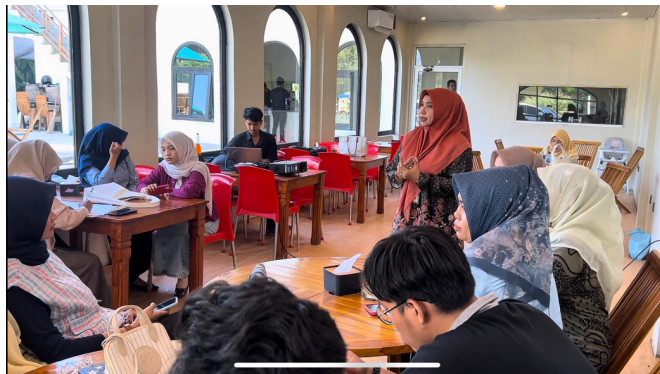
Gambar 1. Sesi Pembukaan Acara

Pada tahap awal, kegiatan dibuka secara resmi oleh ketua pelaksana yang sekaligus memberikan pengantar mengenai pentingnya pencatatan keuangan berbasis digital. Kegiatan ini mendukung pandangan Valdiansyah & Widiyati [10] bahwa edukasi awal merupakan kunci dalam membangun kesadaran pelaku usaha terhadap manfaat digitalisasi.