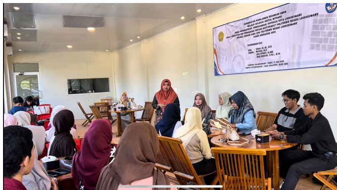
Gambar 4. Sesi Pendampingan

Kegiatan juga dilengkapi dengan sesi pendampingan langsung, di mana tim membantu peserta mengatasi kendala teknis dalam menggunakan aplikasi. Dengan adanya pendampingan, peserta lebih percaya diri dan mampu menjalankan aplikasi secara mandiri. Hal ini sesuai dengan temuan Akhmad et al. [5] bahwa pendampingan jangka pendek maupun jangka panjang berpengaruh pada keberlanjutan adopsi teknologi.