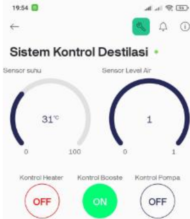
Gambar 5 Pengujian Sistem IoT pada ketel air asupan menggunakan blynk iot

Pengujian IoT (Internet of Things) pada pengontrolan ketel pemanas air asupan diperlihatkan pada Gambar 5 dan Gambar 5.