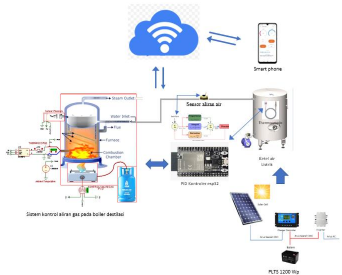
Gambar 1 Desain dan Implementasi Sistem Kontrol PID (Proportional Integral Derivative) pada Boiler Destilasi dan Ketel Air Asupan Menggunakan Hybrid System