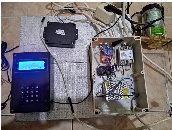
Gambar 2. Pabrikasi sistem monitoring dan pengontrolan air asupan boiler destilasi

Hasil pabrikasi sistem monitoring dan pengontrolan air asupan boiler destilasi diperlihatkan pada Gambar 2. Berdasarkan Gambar 2, sistem pemanas air asupan pada boiler destilasi menggunakan ketel air dari stainless steel dengan kapasitas 30 Liter, menggunakan pemanas listrik dengan elemen pemanas 500 W dan 750 W. Menggunakan sensor suhu termokopel dan pompa air boster 130 W. Kebutuhan energi listrik dipenuhi oleh sumber energi dari PLTS. Sistem kontrol menggunakan mikrokontroler Nodemcu esp8266/32 dengan metode PID. Pengontrolan berbasis PID akan memilih salah satu dari dua elemen pemanas pada suhu yang telah ditala (setting temperature). Aliran air panas didasarkan pada level air pada boiler destilasi. Setting level air menggunakan sensor level yang dapat mendeteksi level air pada kaca boiler destilasi. Berdasarkan Gambar 2, sistem kontrol pada boiler destilasi adalah mengontrol aliran gas, dengan cara mengontrol motor servo yang ditempatkan pada kepala tabung gas. Aliran gas pada kompor gas didasarkan suhu pada boiler destilasi. Sedangkan kapasitas air pada boiler destilasi akan berkurang seiring waktu, oleh karena itu diperlukan air asupan dari ketel air pemanas. Cara kerja motor servo didasarkan pada sistem pengontrolan PID.