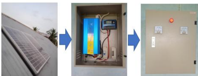
Gambar 3. Sistem PLTS

Sistem PLTS seperti pada Gambar 3, menggunakan solar panel 2x120 Wp, menggunakan kontrol solar panel dan inverter 1000 W, Penyimpan energi menggunakan baterai 12 V, 150 Ah. Dengan waktu penyimpan sehari 7 jam optimal, diperoleh daya maksimal sebesar 7 \times 2 \times 120 \text{ Wp} = 1.680 \text{ Wp} . Dan dengan penyimpanan 12 V, 150 Ah diperoleh daya listrik tersimpan sebesar 12 \times 150 = 1800 \text{ Wjam} . Sumber energi PLTS ini untuk memenuhi kebutuhan energi ketel pemanas air.