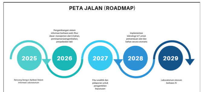
Gambar 3. Roadmap Pengembangan Sistem Informasi Laboratorium 2025–2029

Untuk menjamin keberlanjutan dan pengembangan sistem, disusun peta jalan ( roadmap ) penelitian dan pengembangan selama lima tahun ke depan sebagaimana ditunjukkan pada Gambar 3.