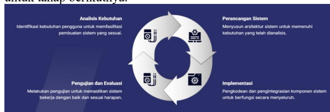
Gambar 1. Tahapan Penelitian

Penelitian ini dilakukan melalui beberapa tahapan yang saling berhubungan sebagaimana ditunjukkan pada Gambar 1 . Setiap tahap memiliki keluaran (output) yang menjadi dasar untuk tahap berikutnya.