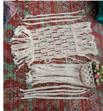
Gambar 2. Contoh Hasil Kreasi Kerajinan Makrame

Beberapa produk makrame yang dapat dihasilkan dari kreasi benang katun/tali kur, antara lain tirai pintu, taplak meja, gantungan pot, kap lampu, dan lain-lain. Proses menjalin benang katun/tali kur yang mudah ditambah kreatifitas yang memadai akan menghasilkan makrame yang cantik dan unik. Pada pelatihan ini sebagai permulaan tim menggunakan tali kur sebagai bahan utama membuat makrame, ini dimaksudkan untuk memudahkan dalam membongkar jalinan jika terjadi kesalahan. Kunci utama dalam membuat makrame adalah melilit, menyimpul, menjalin, dan mengikat.