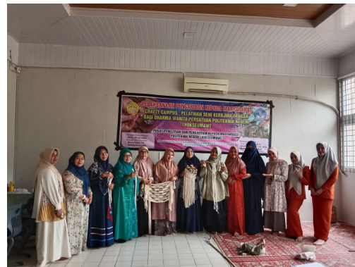
Gambar 3. Tim Pengabdian dan Dharma Wanita PNL

Selanjutnya untuk pelatihan kerajinan makrame di Politeknik Negeri Lhokseumawe, tim pengabdian PNL menetapkan target yang ingin dicapai dan indikator keberhasilan. Ini dimaksudkan untuk mengukur tingkat keberhasilan pelatihan yang telah dilaksanakan. Indikator yang ditetapkan antara lain kecepatan, kerapian, tingkat kreatifitas, dan disiplin. Dari tabel terlihat bahwa dari target yang ingin dicapai sebesar 100%, yang tercapai sebesar 85%, ini disebabkan karena para peserta baru pertama sekali mengenal kerajinan makrame. Hal tersebut berpengaruh pada kecepatan dan kerapian hasil kreasi.