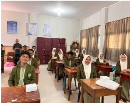
Para peserta pelatihan siswa/siswi MAN Lhokseumawe