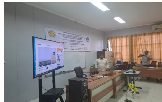
Gambar 2 Pemaparan Materi Pebangunan Desa

Setelah proses diskusi selesai, tahap selanjutnya pemaparan contoh kasus. Pada sesi ini peserta pelatihan mendapatkan penjelasan contoh kasus yang harus yang telah diselesaikan. Untuk ini masing masing kelompok pelatihan akan didampingi oleh tim pelayihan dan pengabdian.