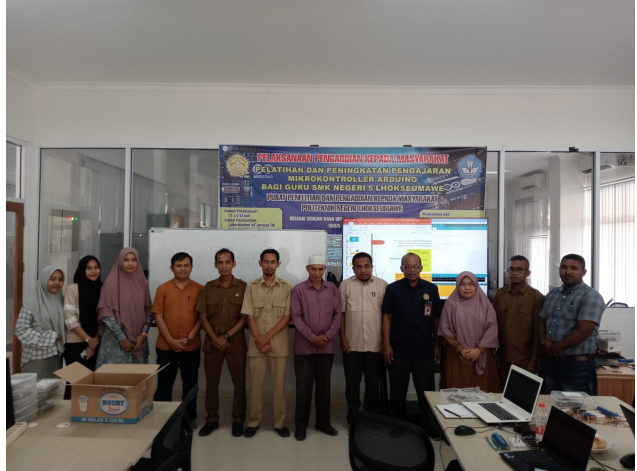
Gambar 1 kegiatan pelaksanaan PKM di Gedung Jurusan TIK

kegiatan PKM dapat terlihat seperti pada gambar 1 sampai dengan 3 berikut: