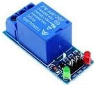
Gambar 3. Relay