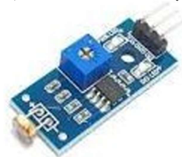
Gambar 2. Sensor Suhu

Sensor adalah alat untuk mendeteksi kondisi disekitarnya seperti suhu, kelembaban dan intensitas cahaya.