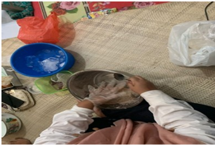
Gambar 2. Proses pembuatan bakso ikan tongkol