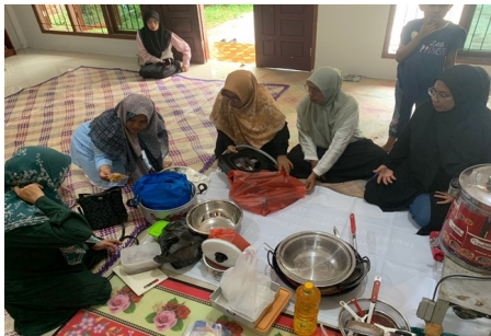
Gambar 4. Proses pembuatan nugget udang