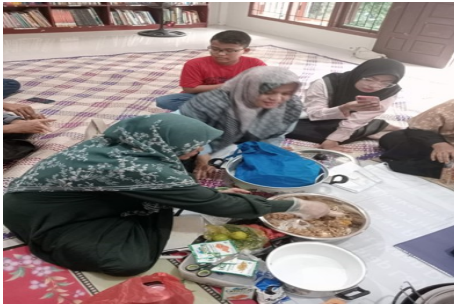
Gambar 3. Proses pembuatan udang crispy