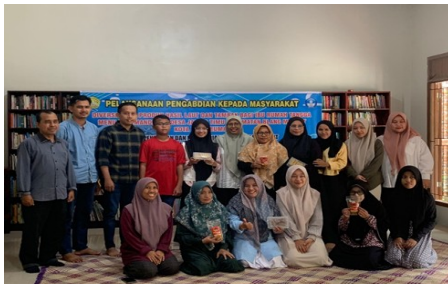
Gambar 5. Foto bersama Tim dan Mitra

50% dan setelah kegiatan meningkat menjadi 85%. Rata-rata persentase kemampuan mitra dalam mengolah hasil laut dan tambah serta pengetahuan isin usaha meningkat menjadi 61,3%.