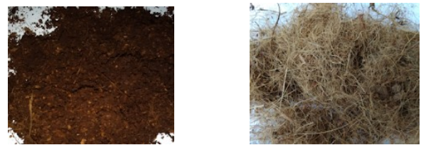
Gambar 2. (a) Cocopeat dan (b) Cocofiber

Mesin pengurai sabut kelapa ini sangat efisien dalam memproses sabut kelapa dalam jumlah besar dan menghasilkan produk cocopeat dan cocofiber yang siap dipasarkan. Hasil pengujian menghasilkan cocopeat dan cocofiber dengan ukuran yang relatif seragam seperti pada gambar 2.