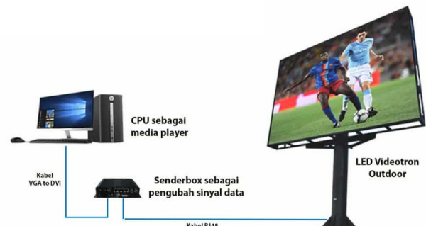
Gambar 1. Topologi Perancangan Prototipe Videotron Outdoor.

Prototipe ini dirancang dengan mempertimbangkan efisiensi energi dan kualitas visual. Penggunaan modul LED SMD 1921 menjadi pilihan utama karena LED ini dikenal memiliki tingkat efisiensi yang tinggi serta dapat menghasilkan kualitas warna yang baik [5]. Kerapatan pixel P3.91 memastikan bahwa gambar yang ditampilkan memiliki ketajaman dan kejernihan yang baik, sehingga cocok untuk aplikasi luar ruangan.