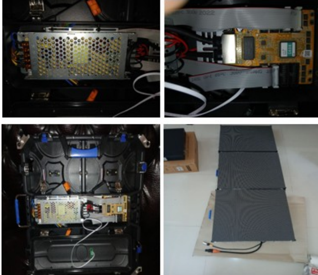
Gambar 2. Perakitan Layar Videotron

Tahap awal dalam metodologi ini adalah pengujian konsumsi daya listrik dari prototipe videotron. Pengujian dilakukan dalam berbagai kondisi kecerahan: maksimum, menengah, dan minimum. Untuk mengukur konsumsi daya, digunakan alat pengukur daya yang dapat memberikan data akurat mengenai jumlah energi yang digunakan oleh sistem selama beroperasi [6]. Data yang diperoleh kemudian dicatat dan dibandingkan untuk menganalisis pengaruh pengaturan kecerahan terhadap konsumsi daya.