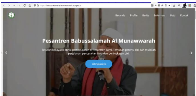
Gambar 1. Website Pesantren Babussalamah Al Munawwarah

Menghasilkan luaran berupa website portal untuk pesantren. Berikut adalah beberapa contoh website yang telah dibuat dan diserahkan oleh tim pengabdian untuk pesantren seperti yang ditunjukkan pada Gambar 1, Gambar 2 dan Gambar 3.