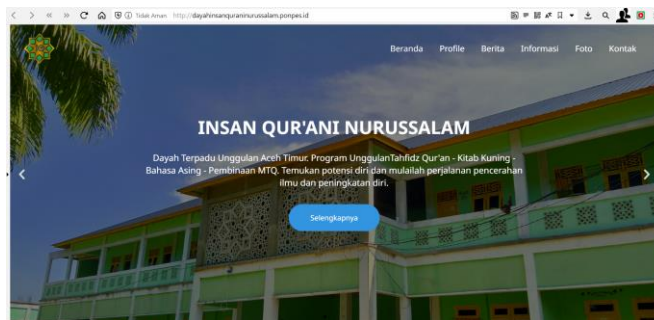
Gambar 3. Website Pesantren Insan Qur'ani Nurussalam

Menghasilkan luaran berupa website portal untuk pesantren. Berikut adalah beberapa contoh website yang telah dibuat dan diserahkan oleh tim pengabdian untuk pesantren seperti yang ditunjukkan pada Gambar 1, Gambar 2 dan Gambar 3.