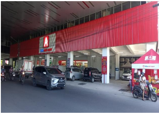
Gambar 1. Kondisi eksisting Alfamidi Super

Alfamidi Super termasuk dalam kategori jenis usaha dan/atau kegiatan yang wajib membuat Teknis Penanganan Dampak Lalu Lintas sebagaimana Peraturan Menteri Perhubungan Nomor PM 17 Tahun 2021 tentang Penyelenggaraan Analisis Dampak lalu Lintas (Fadlika et al., 2021) dan Peraturan Pemerintah Nomor 30 Tahun 2022 tentang Peraturan Pelaksanaan UU No.11 Tahun 2020 tentang Cipta Kerja untuk lalu lintas dan Angkutan Jalan (Antow & Mamesah, 2016), atas dasar tersebut maka pihak Pembangun/Pengembang Alfamidi Super harus menyusun pelaporan Teknis Dampak Lalu Lintas yang diperlukan sebagai acuan untuk melakukan pengelolaan dan pemantauan dampak lalu lintas, baik pada tahap pra-konstruksi, konstruksi dan terutama pasca-konstruksi (Tahap Operasional) dan lima tahun Operasional.