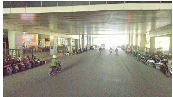
Gambar 2. Lapisan perkerasan lentur

Kondisi alinyemen melintang perkerasan dapat dilihat pada Gambar 2.