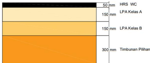
Gambar 3. Desain fondasi perkerasan lentur

Dari hasil tebal perkerasan, didapatkan bentuk desain fondasi perkerasan lentur yang ditunjukkan pada Gambar 3.