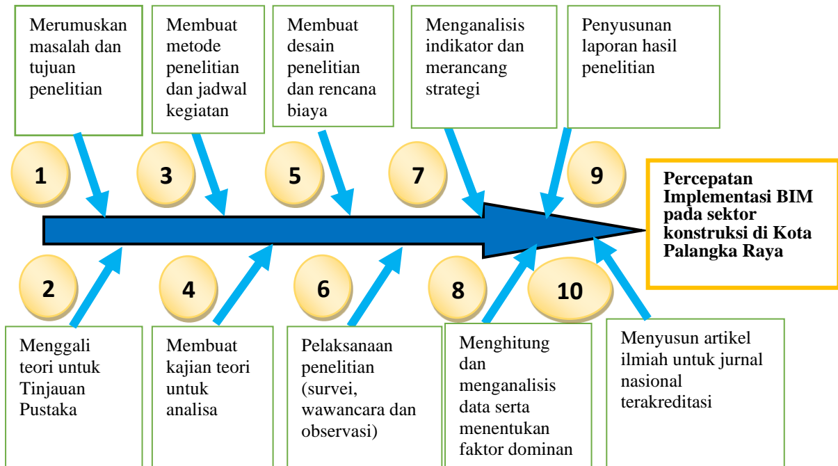
Gambar 1. Skema penelitian

Nilai mean , dan standar deviasi untuk memperoleh data berupa ranking/peringkat dari indikator dan faktor keunggulan dan hambatan terhadap implementasi BIM pada Proyek Konstruksi menurut pandangan pelaku jasa konstruksi di Kota Palangka Raya.