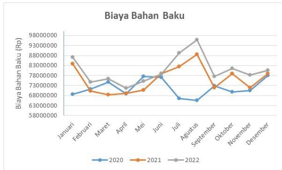
Gambar 1. Grafik Biaya Bahan Baku Surpet Sayida Empat Serangkai Mandiri Periode 2020 – 2022

Berdasarkan Gambar 1, diketahui nilai rata-rata biaya bahan baku selama 3 tahun atau 36 bulan adalah Rp.76.201.403 perbulan, dengan nilai tertinggi sebesar Rp.95.928.566 dan nilai terendah biaya bahan baku Rp. 66.486.191. Dalam kurun waktu satu bulan, jumlah pemakaian bahan baku tidak sama dengan bulan lainnya.