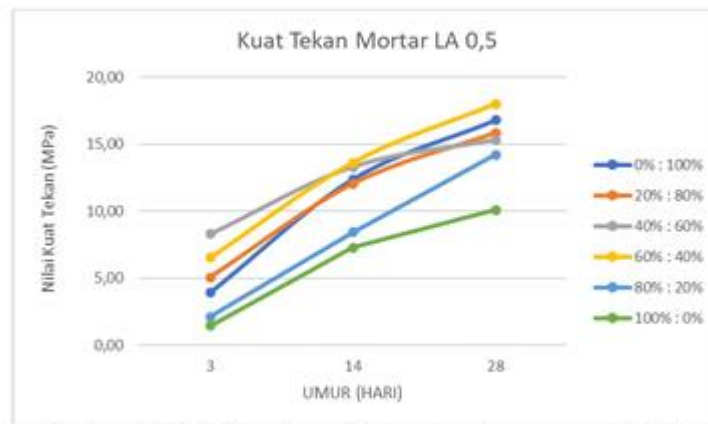
Gambar 4 Grafik Kuat Tekan Mortar Geopolimer dengan LA 0.5

tunggal baik FANR maupun FAPS memberikan hasil yang rendah, menegaskan bahwa kombinasi kedua material memberikan efek sinergis dalam meningkatkan kekuatan mortar geopolimer.