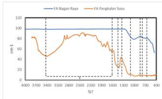
Gambar 1 Grafik FTIR dari FAPS dan FANR

teridentifikasi. FAPS memiliki jumlah pita puncak lebih banyak pada daerah serapan gugus \text{Ca}(\text{OH})_2 , \text{H}-\text{O}-\text{H} , \text{CaCO}_3 , serta ikatan \text{Si}-\text{O}-\text{Si}/\text{Si}-\text{O}-\text{Al} dibanding FANR. Hal ini menandakan bahwa FAPS lebih kaya akan gugus fungsional yang berperan penting dalam proses geopolimerisasi, seperti peregangan ikatan silikat dan aluminat yang menjadi dasar pembentukan gel aluminosilikat. Sebaliknya, FANR cenderung menunjukkan pita yang lebih sedikit, meskipun pada rentang 680-800 \text{ cm}^{-1} ditemukan kandungan alkali yang lebih tinggi, yang dapat mendukung aktivasi kimia pada proses awal reaksi. Kecenderungan ini juga terlihat jelas pada grafik FTIR, dimana spektrum FAPS (garis orange) menunjukkan banyak lekukan dan puncak serapan kuat pada berbagai bilangan gelombang, khususnya di daerah sekitar 3440 \text{ cm}^{-1} , 1630 \text{ cm}^{-1} , dan 1000 \text{ cm}^{-1} . Sementara itu, spektrum FANR (garis biru) relatif datar dengan lebih sedikit variasi puncak, yang sejalan dengan data jumlah pita pada gambar. Dengan demikian, dapat disimpulkan bahwa FAPS memiliki potensi reaktivitas kimia lebih tinggi karena mengandung lebih banyak gugus aktif yang dapat mempercepat proses pozzolan dan geopolimerisasi, sedangkan FANR lebih berperan dalam memberikan kontribusi kandungan alkali yang menjaga kestabilan sistem ikatan pada mortar geopolimer.