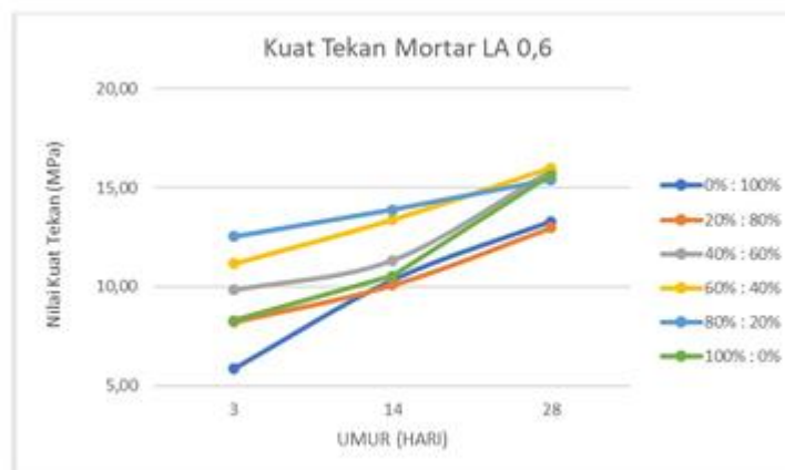
Gambar 3 Grafik Kuat Tekan Mortar Geopolimer dengan LA 0.6

Citra SEM Morphologi permukaan (a) FAPS (b) FANR Berdasarkan grafik kuat tekan mortar geopolimer dengan rasio LA/FA 0,6 dan 0,5, terlihat bahwa seluruh variasi campuran mengalami peningkatan nilai kuat tekan seiring bertambahnya umur pengujian. Pada rasio 0,6, nilai kuat tekan maksimum dicapai oleh campuran 60% FANR : 40% FAPS dan 80% : 20% dengan hasil sekitar 16 MPa pada umur 28 hari. Meskipun demikian, kuat tekan yang dihasilkan masih lebih rendah dibandingkan dengan rasio 0,5. Hal ini mengindikasikan bahwa penggunaan larutan alkali yang terlalu tinggi dapat menghambat proses polikondensasi, karena kelebihan ion \text{OH}^- berpotensi menimbulkan porositas pada struktur mortar, sehingga mengurangi kepadatan dan kekuatannya.