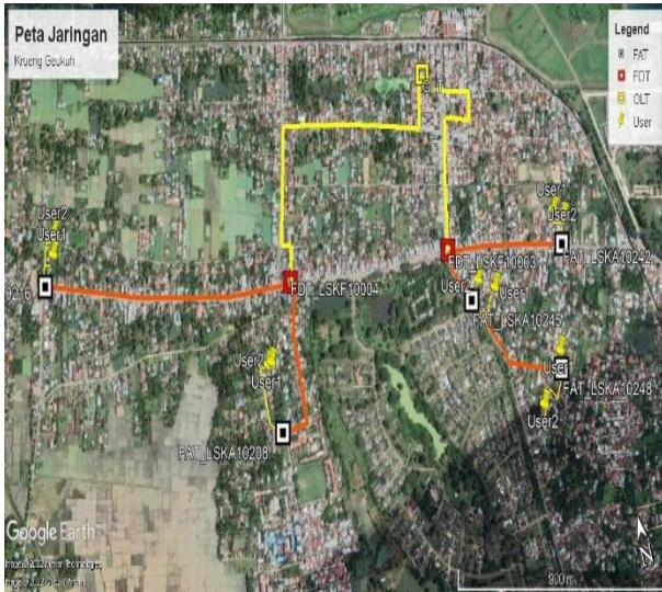
Gbr 3. Peta Krueng Geukuh

Lokasi pada penelitian ini berlokasi di wilayah Krueng Geukuh, Kecamatan Dewantara, Kabupaten Aceh Utara. Lokasi ini dipilih karena pembangunan jaringan FTTH yang masih baru. Lokasi penelitian ini dapat dilihat pada Gambar 3..