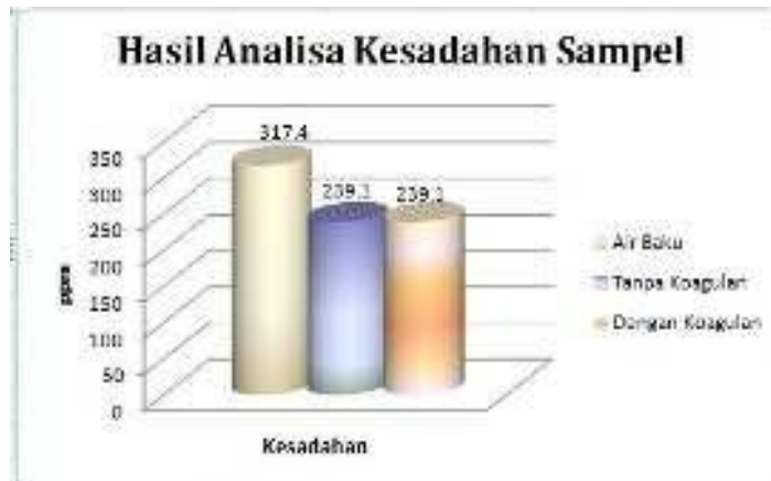
Gambar 2. Hasil Analisa Kesadahan Sampel