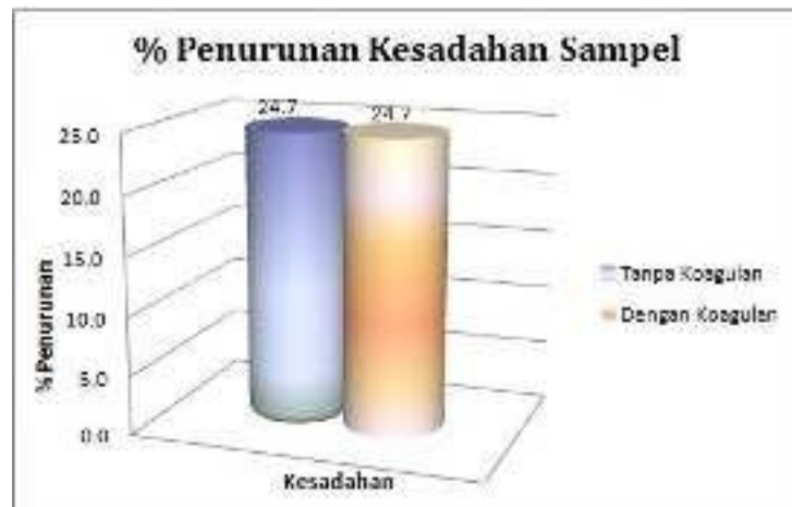
Gambar 1. Efisiensi Penurunan Kesadahan Sampel

efisiensi penurunan kesadahan adalah sebesar 24.7%, baik itu dengan menggunakan koagulan maupun tanpa koagulan. Dalam proses penurunan kesadahan sampel dengan menggunakan koagulan mempunyai efisiensi yang sama, hal ini menunjukkan bahwa koagulan yang digunakan masih kurang berpengaruh dalam penurunan kesadahan. Adapun kandungan kesadahan total air gambut sebelum pengolahannya itu sebesar 317,4 ppm sedangkan kandungan kesadahan total setelah proses yaitu sebesar 239,1 ppm dengan efisiensi penurunan sebesar 24,7 %. Kandungan kesadahan total air gambut baik itu setelah proses ataupunsebelum proses sama-sama masih berada dalam standar bakumutu air minum KEPMENKES No.492/Menkes/Per/IV/2010.