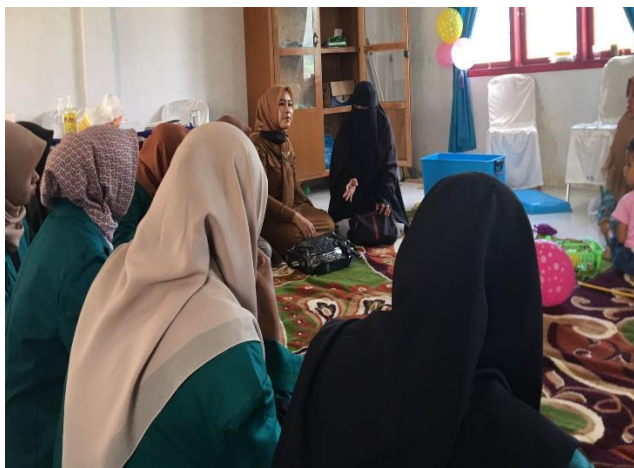
Gambar 1. Kegiatan berdiskusi Bersama Ibu – Ibu Rumah Tangga Gampong Nya