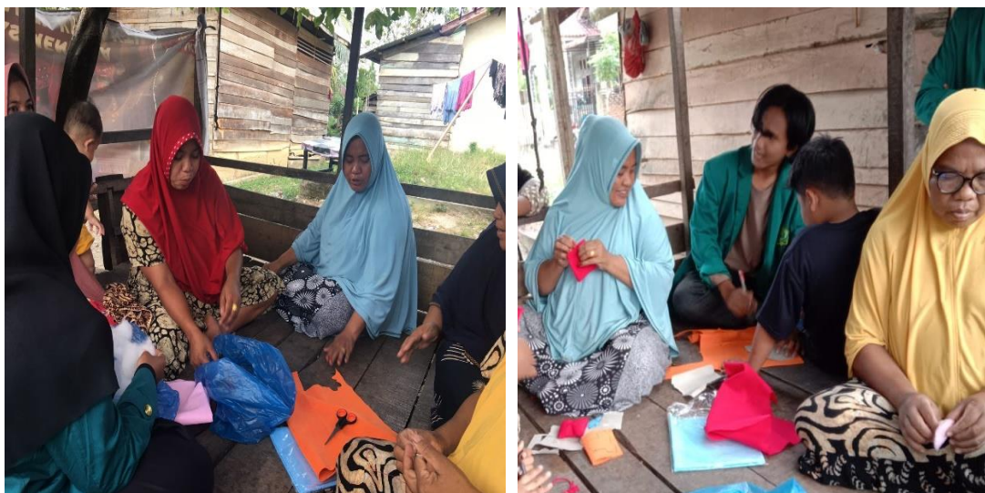
Gambar 3. Kegiatan Pembuatan Souvenir Gantungan Kunci