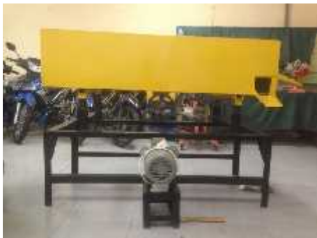
Gambar 2. Mesin sortir biji kopi

Adapun hasil dari pembuatan mesin sortir biji kopi seperti diperlihatkan pada Gambar 2.